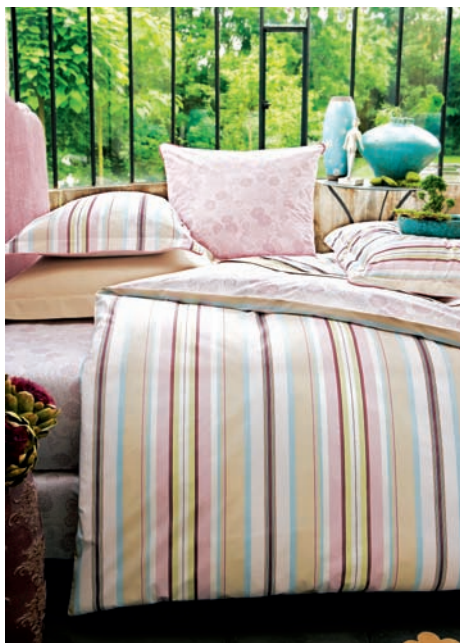
图2-3 家用纺织品配套