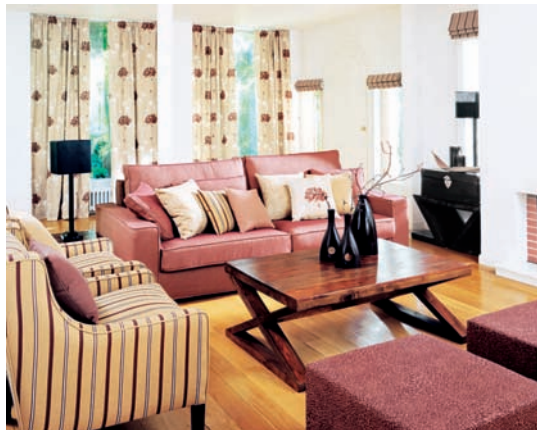
图2-4 家用纺织品配套