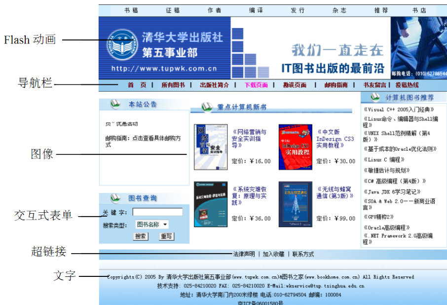
图 1-2 网页的组成元素