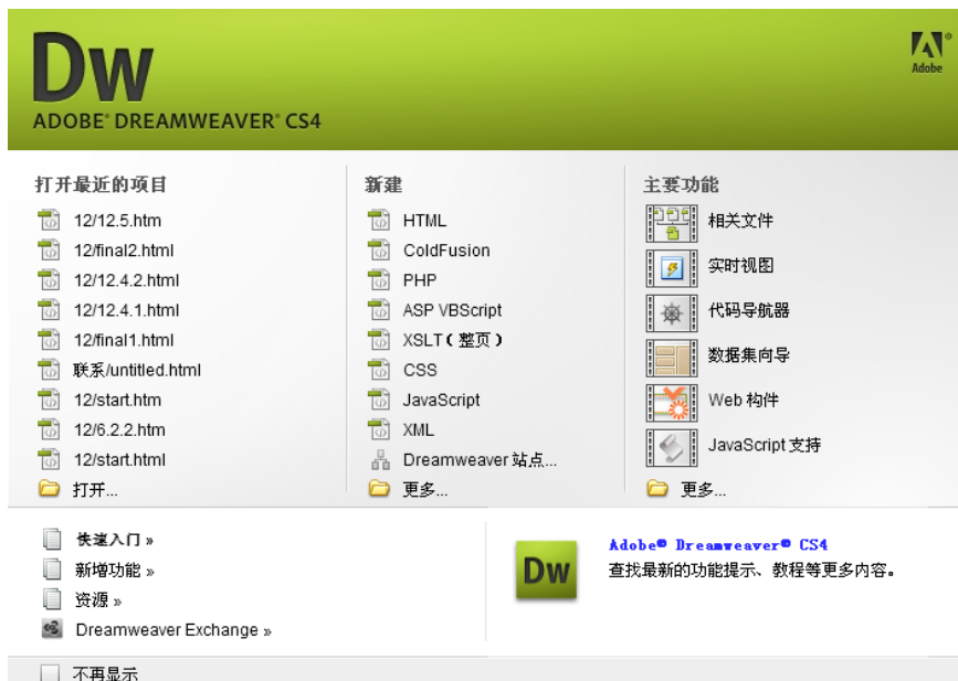
图 1-4 “欢迎屏幕”

通过【新建】区域，用户可以选择要创建页面的类型或基于的模板，它们提供了制作网页的起点，而每一个都有不同的页面布局。通过屏幕底部的【快速入门】、【新增功能】等链接，用户还可以浏览 Dreamweaver CS4 提供的相关帮助内容或主题。选中【不再提示】复选框，下次启动 Dreamweaver CS4 时将不再出现“欢迎屏幕”。