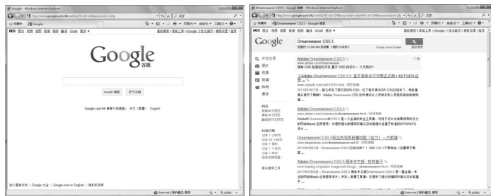
图1-1 谷歌搜索到的相关信息

在因特网上查找信息，“搜索”是最好的办法。比如可以使用搜索引擎Google。它提供了强大的搜索能力，用户只需要在文本框中输入几个查找内容的关键字，就可以找到成千上万与之相关的信息，如图1-1所示。