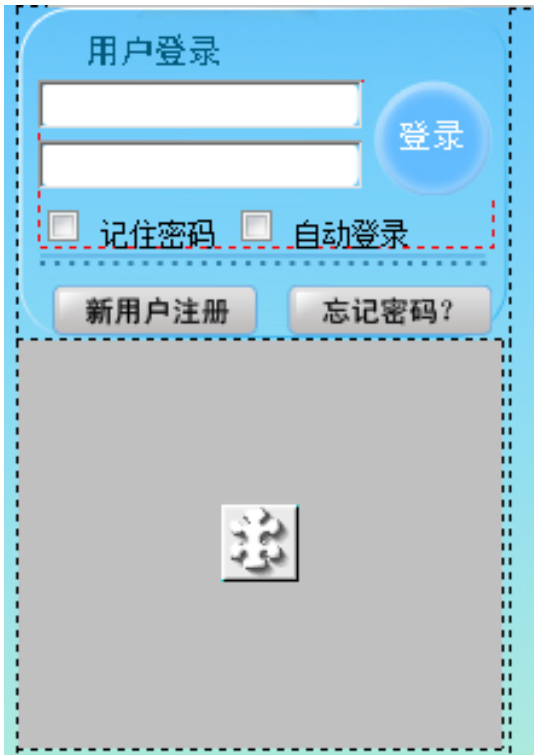
● 第17天 制作会员登录 视频: 制作会员登录.swf 源文件: index.html