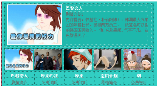
● 第19天 CSS样式表的应用 视频: 创建内部样式表.swf、创建外部样式表.swf 源文件: index.html