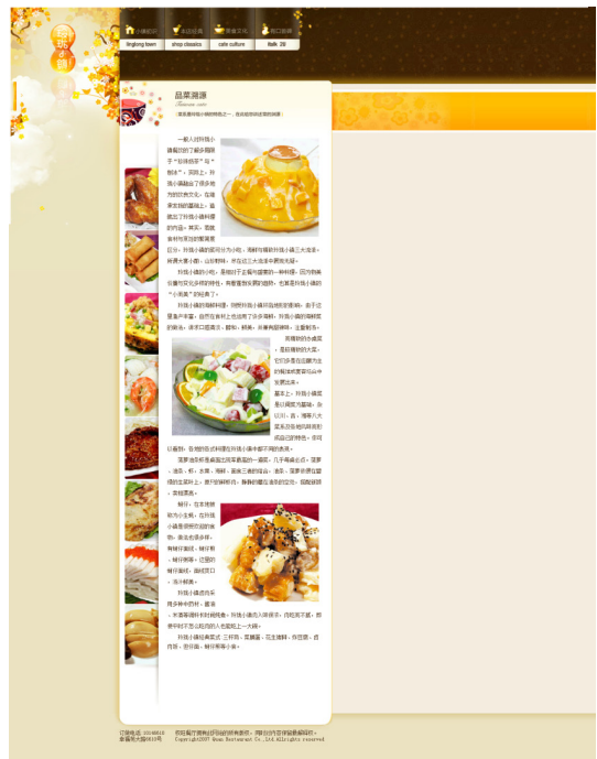
● 第18天 网站中文字要素 视频: 插入列表.swf、插入日期.swf、插入注释.swf、简单的图文混排效果.swf 源文件: index01.html、index02.html