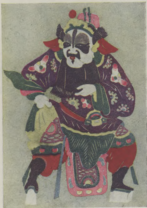
訪 札：尉遲恭（王老賞作）