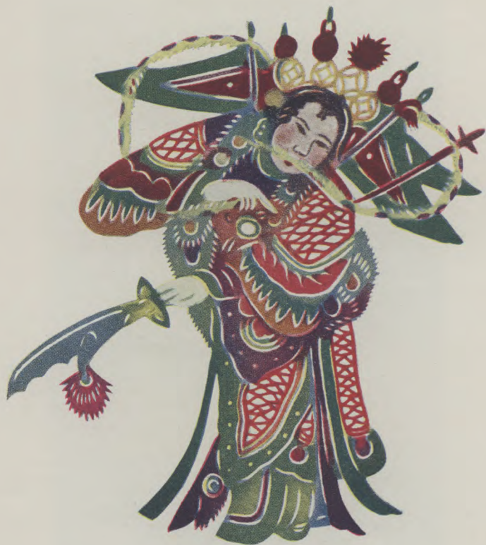
烈火旗：双陽公主（王老賞作）