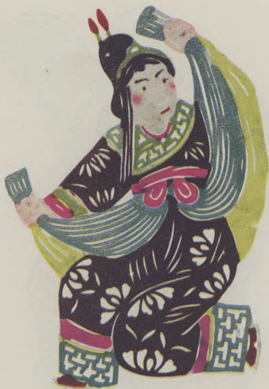
逍遙津：伏皇后（王老賞作）