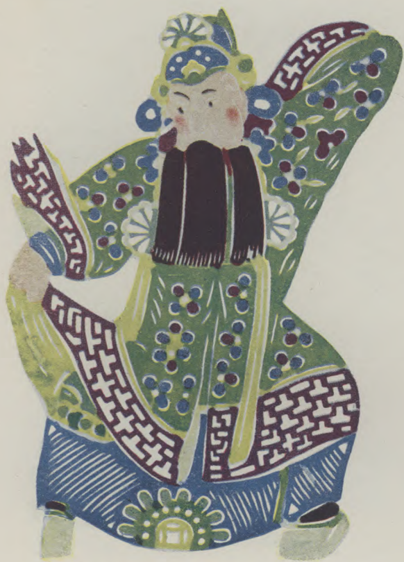
遼遙津：漢獻帝（王老賞作）