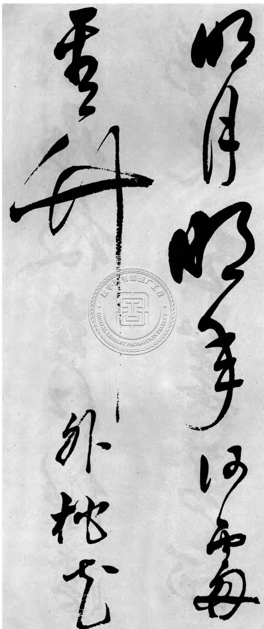
明月明年何处看 竹外桃花