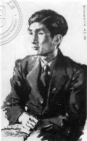
張深切畫像（1939年，36歲。蔣兆和作，張孫煜收藏）按，蔣兆和為著名水墨畫家，本作於北平藝專辦公室以一小時完成。