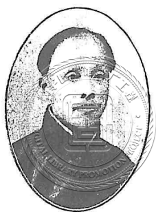
無錫病驥人四十八歲小影