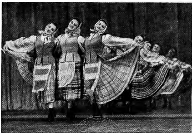
別洛露西亞〔馬鈴薯〕舞