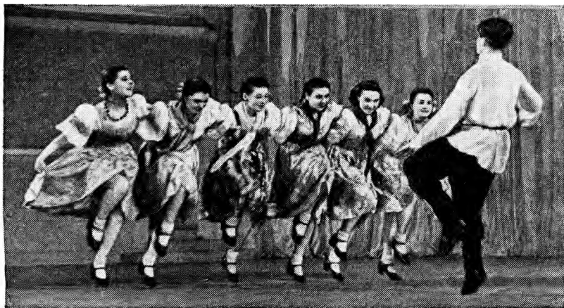
俄罗斯〔林中空地〕舞