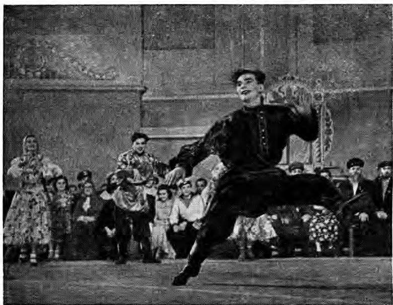
舞剧《集体农庄的节日》