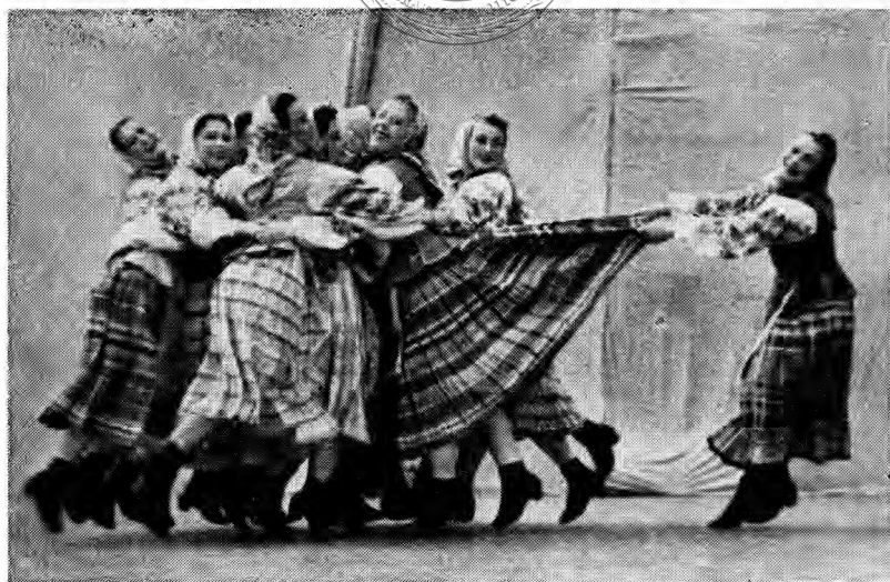
別洛露西亞〔馬鈴薯〕舞