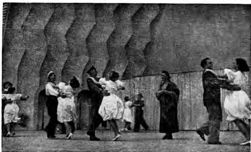
舞剧《集体农庄的节日》