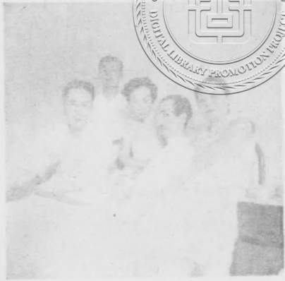
(一九四三年七月攝於醫院)