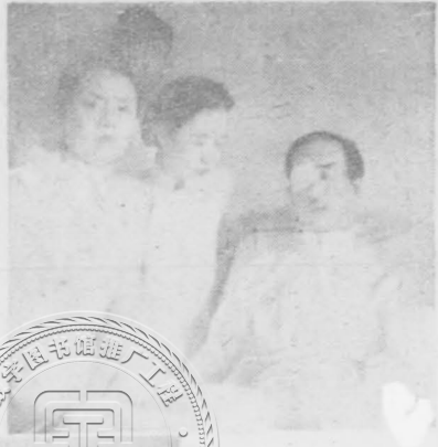
韜奮先生病中與家屬合影