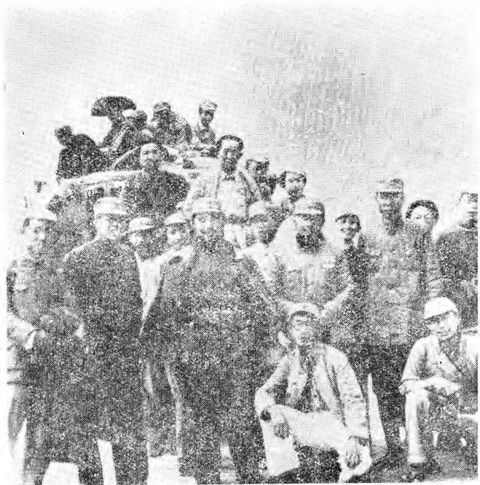
去华北敌后——晋察冀 在延安出发时摄