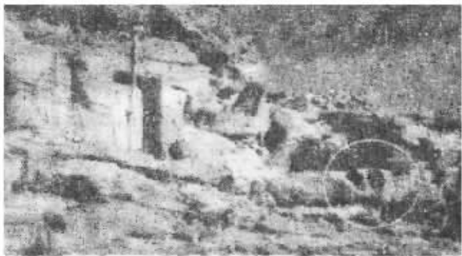
成吉思汗曾在此养伤的阿尔寨石窟

鄂托克旗附近的“百眼井”；“驼羔梁”，，等是成吉思汗晚年活动的另外几个遗迹。据潘照东介绍，传说中的百眼井因风沙的侵蚀而埋没，如今只剩下了 80 多眼，但井壁非常光滑圆润，而且分布合理。