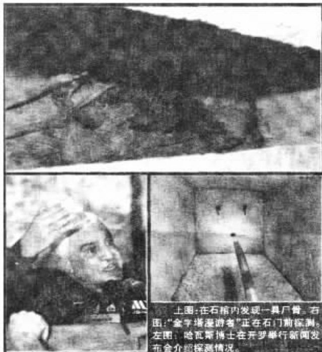
上图：在石棺内发现一具尸骨。右图：“金字塔漫游者”正在石门前探测。左图：哈瓦斯博士在开罗举行新闻发布会介绍探测情况。