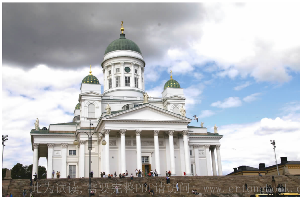
◀ 教堂 Church