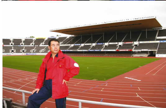
◀ 刘翔曾在此夺冠(赫尔辛基体育场) Xiang Liu once got his championship here (Helsinki Palaestra).