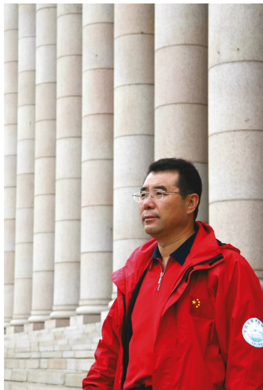
▲ 芬兰赫尔辛基博物馆前 In front of the Helsinki Museum in Finland

2006年7月20日下午3点30分，我们来到芬兰湾，进行北极挑战的境外首次试水。这里是波罗地海的小海湾，水温13℃，许多当地人在水边嬉戏。我换好泳装，兴奋不已，多少天没下海游泳了。向岸上的记者和观众挥了挥手，我跃入海中，就像鱼儿回到了水中。海湾里的游艇、摩托艇激起层层浪花，伴我游了27分钟，1200米。