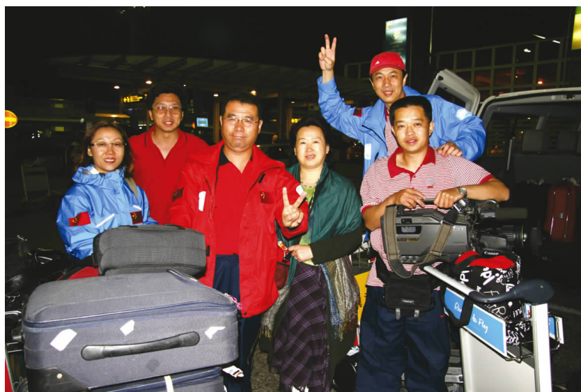
▼全体探险队员从北京出发 all the adventure team members setting off from Beijing

五年前,朋友们在北京送我出发挑战南极,使我一举成了南极勇士。今天,朋友们又在北京为我壮行去征服北极,再次从北京乘坐飞机飞离祖国,去实现我从南极到北极的跨越,实现挑战南北极冰海世界第一人的梦想。