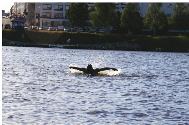
◀ 凯米河抗寒训练 anti-coldness training in the Kaimi River