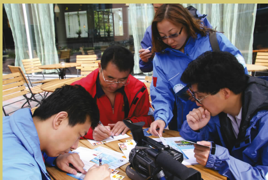
◀在芬兰邮局往中国寄首日封 sending first-day cover to China from Finland post office

晚 7 点 20 分,我率领北极探险队乘坐的欧洲火车徐徐开动,它载着我们的渴望、载着中国人的梦想向北极进发了。我们要前往北极之行的第二站——位于北极圈的著名芬兰城市罗瓦涅米,去拜访那位与原联合国秘书长安南有着不解之缘的圣诞老人。