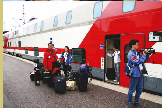
◀乘火车向北极进发 setting out for the Arctic by train