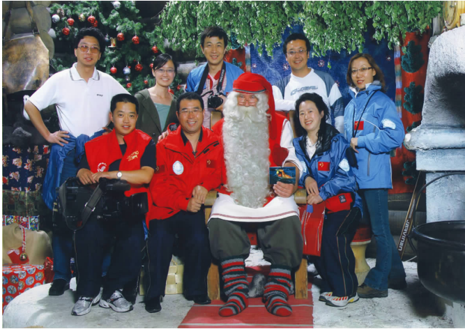
◀ 圣诞老人热情接待全体探险队员 Santa Claus fervidly welcoming the adventure team

北极探险队队员们来到圣诞老人办公室,因为原联合国秘书长安南曾给这里的圣诞老人发信,使该圣诞老人村名声大增,来这里的游客如果与圣诞老人合影,要排长队并花 19 欧元,绝对不允许自己照相或者摄像。马导与管理人员交涉,当得知我们来自中国,是去挑战北极冰海时,管理人员特许我们免费摄像。大家兴高采烈地跟原装正版的圣诞老人亲密交流、零距离地讨教人生秘诀。圣诞老人手拿我的明信片伸出大拇指,说恭喜发财,祝中国冰人北极探险成功!还说下一次我们在北京相见。