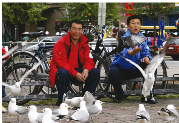
◀ 和平之旅 peace travel