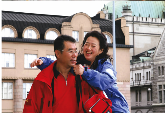
◀ 勇士和娇妻 the hero and his wife