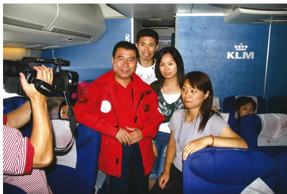
◀ “丹东荣誉市民”在荷航上遇丹东同胞 Dandong honorary citizen encountering Dandong townies