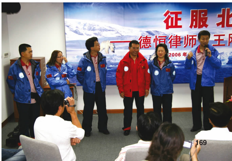
► 挑战北极小分队全体成员 group photo of the Arctic challenging team