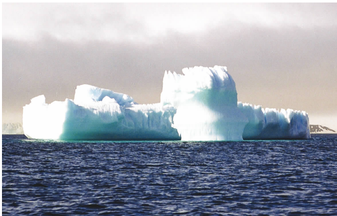
▲ 南极海上“冰城” the ice castle in the Antarctic sea

The Codfish Originating the Challenges to the Ice Sea in the Antarctic