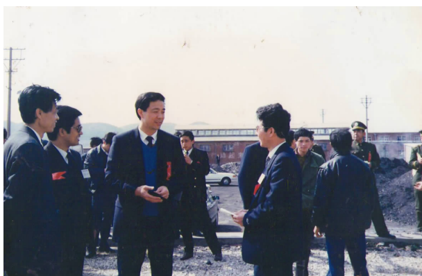
▲原大连市长薄熙来支持王刚义的项目 former mayor of Dalian, Bo Xilai, supporting Gangyi Wang's projects

是啊!我们每个中华热血男儿都应该做到:山给我脊梁,我就是峰;云给我翅膀,我就是鹰;海给我力量,我就是龙!生命不息,挑战不止。