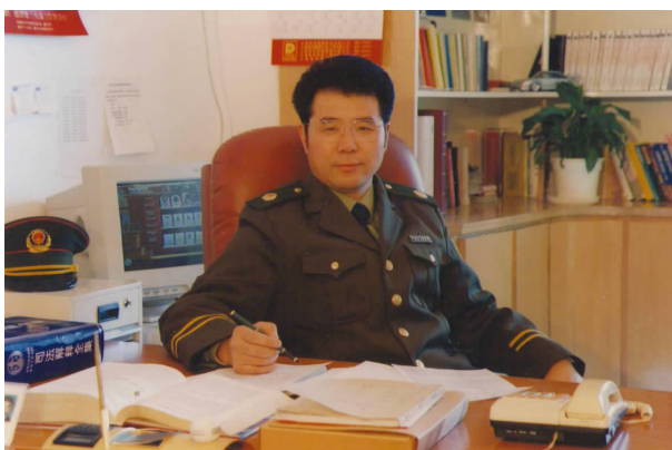
►法律服务工作者 working as a lawyer