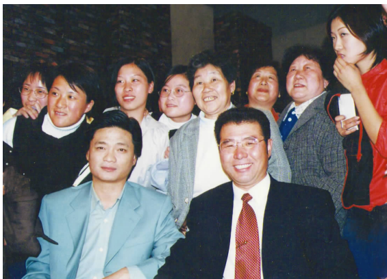
▲《实话实说》节目 the TV program “tell it as it is”

次日节目录制完毕,我和余音商量在北京停留两天。一是到国家工商总局致谢,再就是找国家体委和极地考察办公室,探讨我去南极冬泳的计划。我们虽然知道有个极地考察办公室,却不知道办公地点和负责的工作范围。此外,我还要去智利驻北京大使馆,了解有关签证的情况。