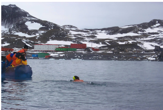
▲ 返回南极长城站 returning to the Great Wall Station in the Antarctic