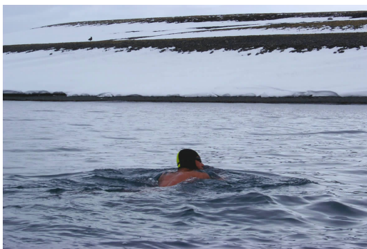
▲ 游到对岸企鹅岛 swimming towards the Penguin Island