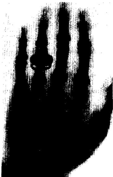
在 X 射线照射下的伦琴夫人的手骨

出一条缝隙。当检查是否漏光时，他意外发现一米之外的荧光屏上有神秘的闪光。他感到惊奇：何以如此？很显然，这无法用阴极射线的有关理论予以恰当的解释：当时科学家们普遍认为，阴极射线的穿透力很差，只能在空气中穿行几厘米。他震惊了，决心搞他个水落石出。于是反复实验，连续