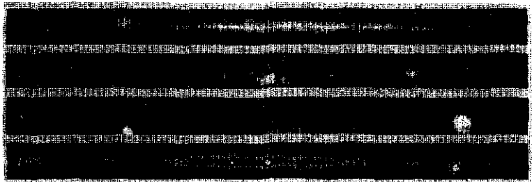
从上到下依次为红外线、光、X射线、 \gamma 射线