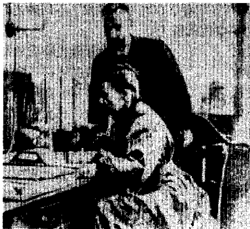
居里夫妇在工作中

贝克勒耳的发现曾一度不为人所注意,直到 1898 年放射性研究的对象扩大到另一已知元素钍,并且发现了新的放射性物质钷、钋和镭后,贝克勒耳发现的放射性才引起人们的重视。