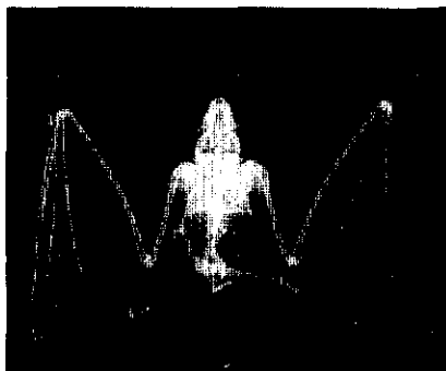
在 X 射线下的蝙蝠骨架

虽然这些科学家都有所创造，在发现 X 射线的历史上留下了不灭的足迹，但他们均功亏一篑。真正作出了实质性发现并轰动世界的，是至今名扬寰宇的德国物理学家伦琴 (W. C. Rontgen)，他改变了人们对阴极射线的看法，准确地确认了阴极射线的本质。他首先使用勒纳德管重复了勒纳德实验，以确证阴极射线能使放电管近旁的荧光屏发光，并达到了目的。随后，他又改用克鲁克斯管继续这项实验。他用黑色纸板把放电管密封起来，然后露