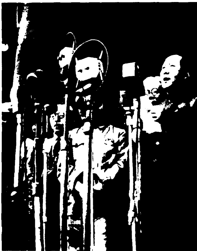
1949年10月1日，毛泽东主席在开国大典上宣读中央人民政府公告