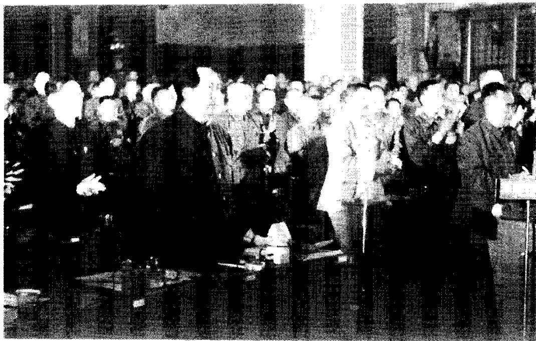
毛泽东当选为中华人民共和国中央 人民政府主席，全体代表起立鼓掌