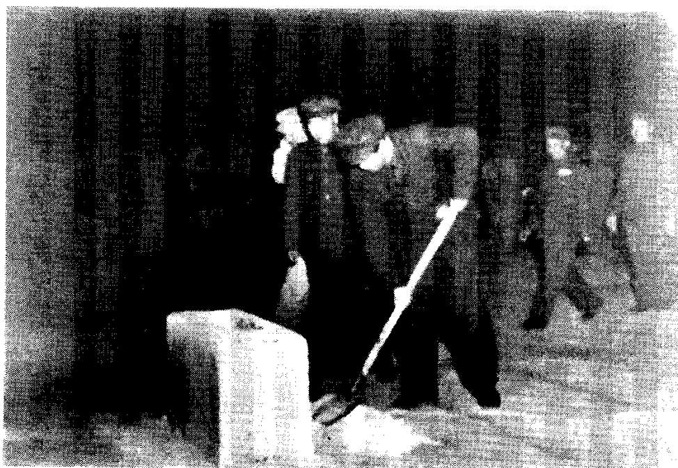
毛泽东、朱德等为人民英雄纪念碑基石培土