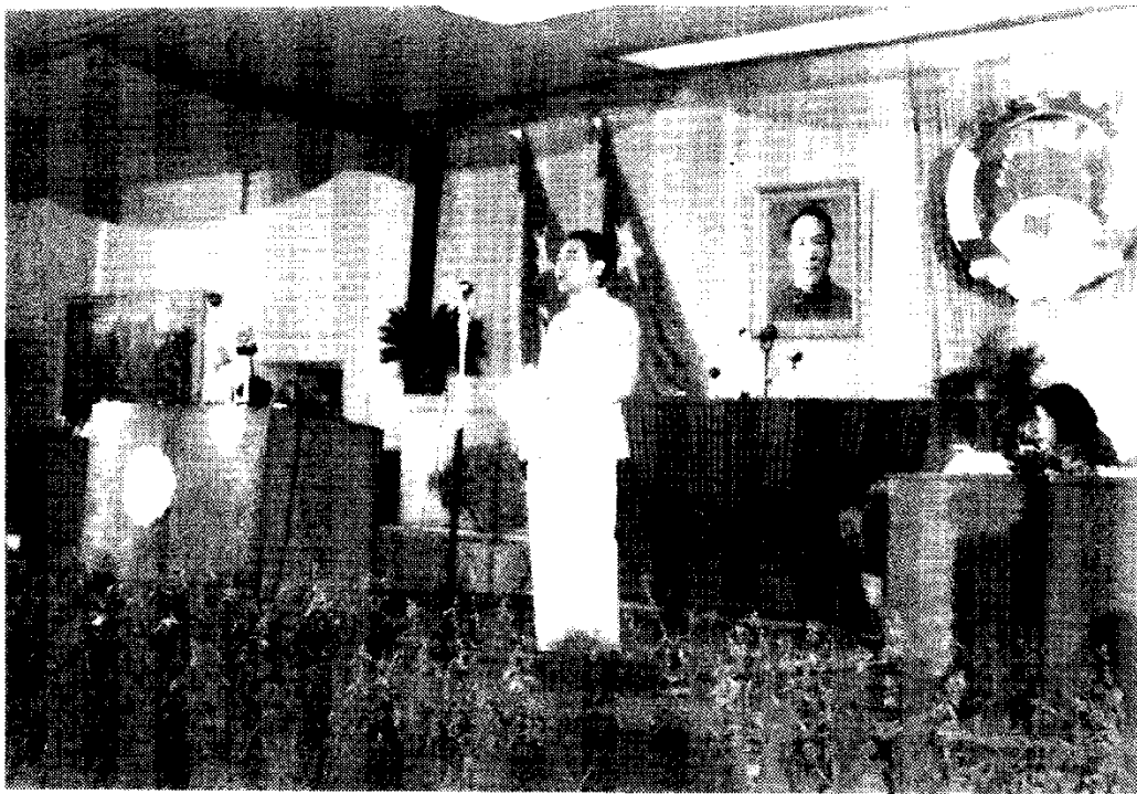
周恩来代表筹备会提请政协第一届全体会议通过主席团名单