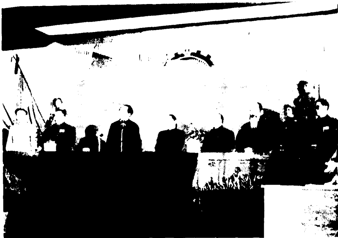
1949年9月30日，政协第一届全体会议举行闭幕式。新当选的中央人民政府主席、副主席登上主席台。左起：刘少奇、朱德、毛泽东、宋庆龄、李济深、张澜、高岗