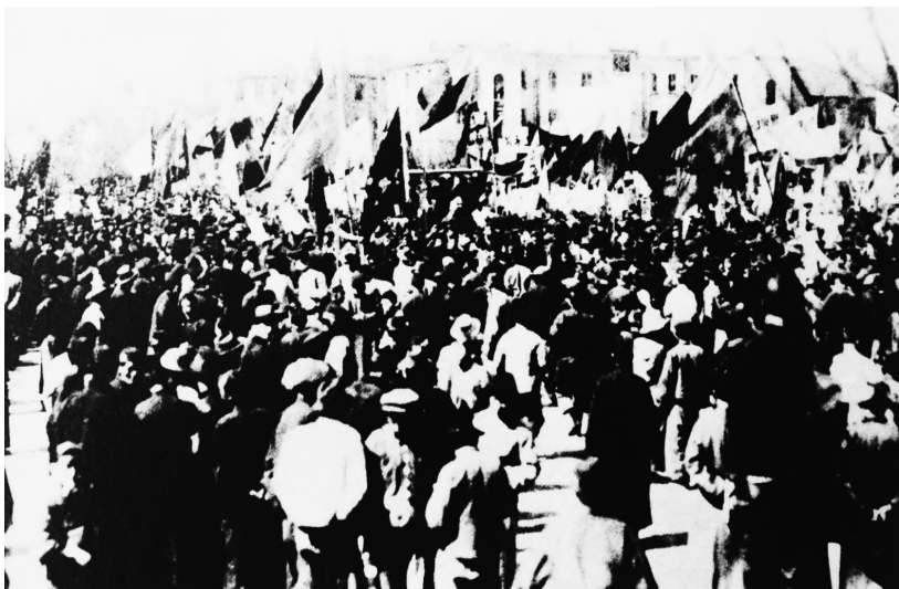
4月12日中午,上海各界民众50万人集会,抗议蒋介石军队的反革命暴行。

人群众包围,逃避不远,故南京焚劫之惨祸,得免现于上海,是役工友死者200余人,伤者在千人以上。本会工友,赴义之勇,与维护地方治安之功绩,早为社会各界所称赞。本会之武装纠察队,即系勇敢工友将夺自奉鲁军手中之枪组成,所以不即解除,盖一则奉鲁军阀未灭,前线战事犹急,北伐党军开上前敌,后方仍须保障,而北洋长警肆虐多年,早在此次战役中溃散,故留此工人武装与商人之保卫团共负治安之责。再者,上海为帝国主义之大本营,为一切买办阶级、军阀官僚、流氓、侦探所汇集地,对于一切革命势力、革命组织必多方肆其破坏,过去帝国主义者、买办阶级收买流氓,资给金钱枪械,使捣毁工会,残杀工人领袖之事,已数见不鲜,今以80万工友之组织保持不满3000人之武装,以为自卫,实有必要。国民政府亦既嘉奖本会工友之起义,并允许保留此工人纠察队为民众自卫之武装,视同正式军队,一律待遇,则凡革命军队领袖,应如何遵照斯旨,爱惜拥护,乃自蒋介石到沪以后,对此有革命历史之总工会和工人纠察队不闻有爱护之意,反只有不慊之言,积极进行其破坏压迫之毒计。呜呼我上海80万工友,牺牲无数性命,所欢迎来的人即是预备屠杀我们的人,是诚我上海工友不及料,而亦一切革命人士所同声悲痛者也。兹将蒋在4月12日前向工人进攻之阴谋列举如下: