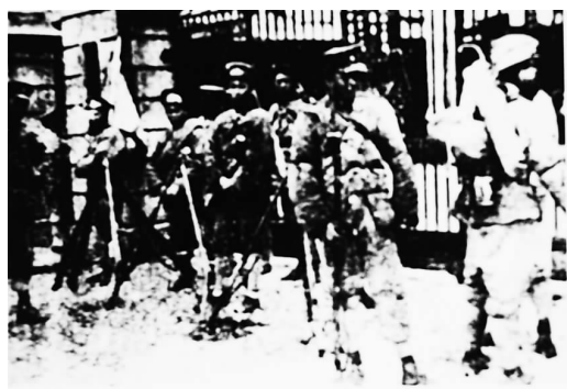
1927年4月12日，蒋介石在上海发动反革命政变，大肆逮捕、杀害工人和共产党员。图为蒋介石军队占领上海工人纠察队队部。

我上海工人，自前年五卅以来完全统一在上海总工会领导之下，与帝国主义、北洋军阀、买办阶级、流氓、侦探艰苦奋斗，不仅为自身谋解放，兼以为市民争自由，为全国求独立解放。自北伐军兴长驱入赣浙，本会更率领全上海80万工友急谋响应。远在去年10月，即曾起义一次，不幸失败，工友死者10余人被拘者100余人；失业者500余人。今年2月2次起义