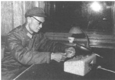
作者在中央人民广播电台播讲雷锋事迹

我们部队有个传统，每年新兵入伍，都要举行欢迎新战友大会。我当时担任团俱乐部主任，操办这类欢迎会是我和有关同志的职责。布置会场，筹办有关事宜，总要忙上几天的。8 日那天上午，满载新兵的列车徐徐驶进营口车站，簇拥在站台上的部队领导和老战士代表敲锣打鼓，高呼口号，热烈欢迎新战友的到来。在几百名走下火车的新战士当中，我看到有个胸前戴着两枚奖章的小战士，身着小号军装似乎还显得有些大，没钉帽徽的棉军帽向后仰戴着，额前露出一绺刘海式短发，显