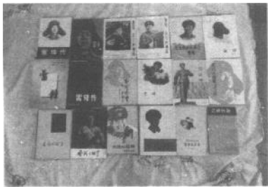
作者编著的部分雷锋书籍

过罢春节不久，部队奉命移防抚顺，执行一项特殊的施工任务——为抚顺钢厂修建厂房。司政、后机关走后，我被留下来组织战士业余演出队，准备为驻地党政机关和人民群众作告别慰问演出。为了在新兵中选拔几名文艺骨干，新兵集训结束时，特意让新