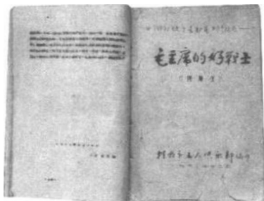
雷锋牺牲后，作者将《向阳坡上长劲苗》改为《毛主席的好战士》，在《抚顺日报》连载后的打印稿

我们团部和新兵连驻地相距不远。雷锋在新兵连集训期间，我们常在操场或路边相遇。每次见面，他总是很有礼貌地给我敬个礼，问声好 很是讨人喜欢。记得有一次他问我 团里有没有图书馆 新兵能不能去借书 我说 我们团常年施工 流动性大 没有建立固定的图书馆，但团俱乐部有几个图书箱 各类书报杂志还是有的 你想看可以随时去借。此后 他到俱乐部找我借过几次书。有时 也闲聊几句 彼此间就较为熟悉了。他平时话儿不多 性格较为内向。记得有一次他来借书，我发现他脸