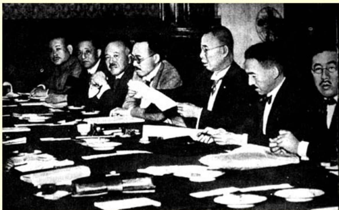
↑一九二七年六月二十七日的“东京会议”。 右起第三人为田中义一