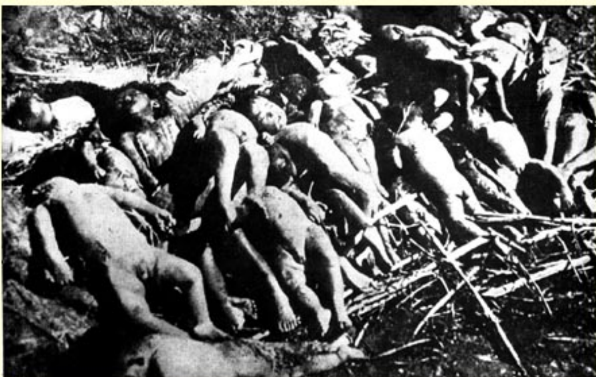
辽宁铁岭龙尾山日军刺杀我幼童之后，集薪待焚