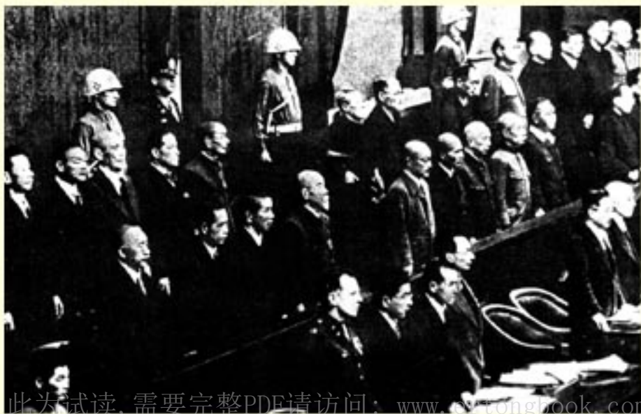
日本战犯受审时情形