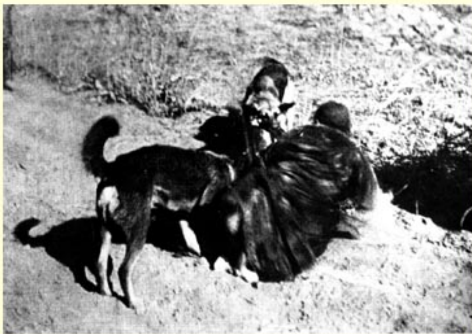
日军放狗咬我同胞