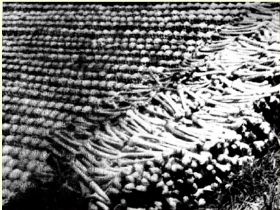
为保卫衡阳，惨遭日军杀害的我抗日军民的遗骸