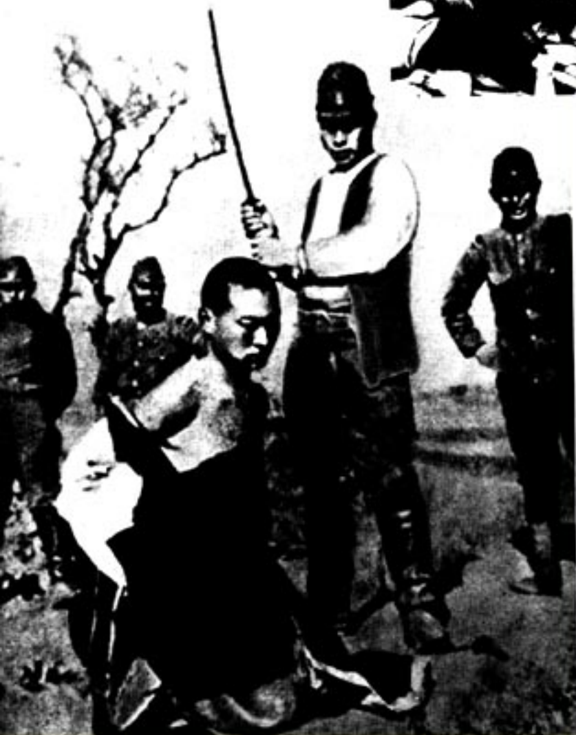
中国军人：被日军砍头