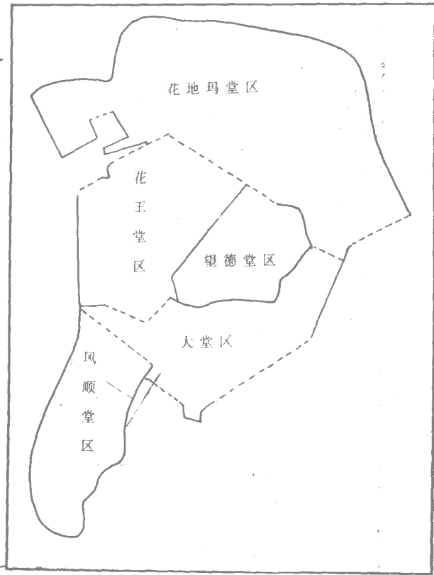
图 1-2 澳门半岛堂区简图