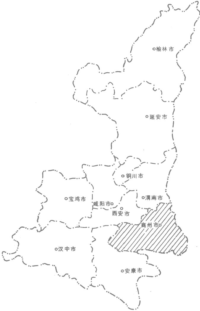
图 1.3 商州市在陕西省的位置