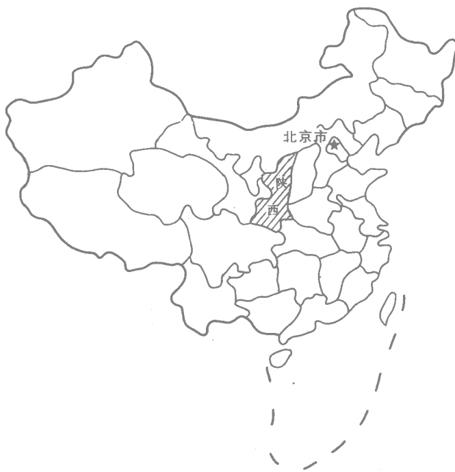
图 1.1 陕西省在全国的位置

经很发达，农田已经建设得很好了。唐朝时，以长安为中心的水利灌溉网络的作用得到了很好发挥，当时关中平原的水浇地已占到了总耕地面积的 10%（李兴平、杨志文，1986）。(3) 陕西是中国古代的政治中心之一。从公元前 1134 年起（距今已 3100 多年）到唐朝止，先后共有 13 个王朝在陕西境内建都。其中有 12 个王朝建都于今西安（西周、秦、西汉、新莽、西晋、前赵、前秦、后秦、西魏、北周、隋、唐）、1 个王朝（大夏王朝）建都于今靖边县的白城子。为此，陕西省会西安在世界上