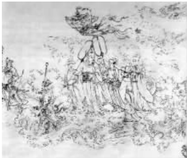
(唐) 吴道子 道教神仙图