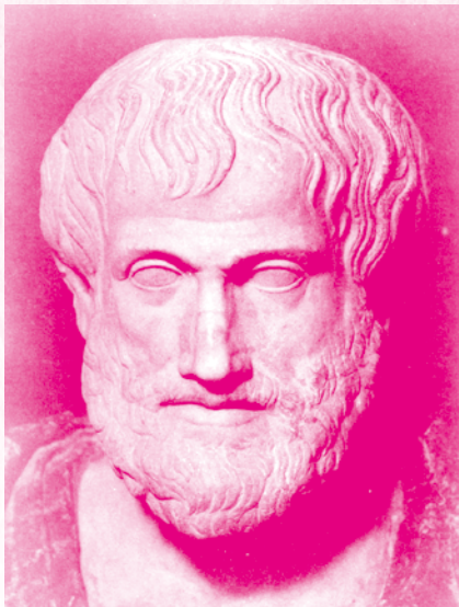
亚历山大大帝的老师亚里士多德雕像

历史上有一种说法，认为亚历山大大帝是双性恋。这种说法也有一定的根据。亚历山大虽然是马其顿的贵族，在当时看来是