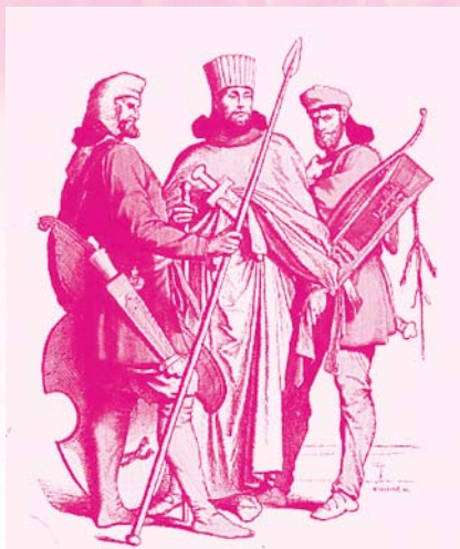
古波斯战士和贵族

无论是时势造就了英雄，还是英雄书写了历史，毫无疑问，英雄的出现成就了更加绮丽与壮阔的历史画卷。