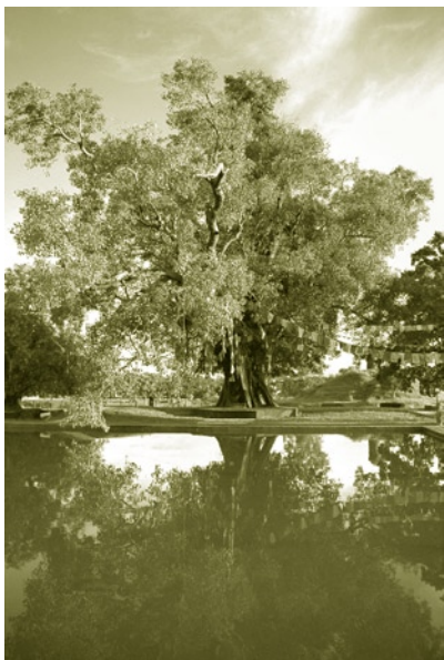
◎ 蓝毗尼花园中释迦牟尼佛诞生处的水池