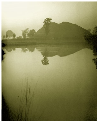
◎ 释迦牟尼涅槃地—拘尸那伽

但他还是毅然出家苦修。经过无数磨难与挫折，他终于在菩提伽耶的一棵菩提树下（毕钵罗树）悟道成佛。所谓成佛，就是成为觉悟者。菩提伽耶成为佛教第二圣地。释迦牟尼第三个重要经历是初转法轮。释迦牟尼成佛之后，在鹿野苑为他的五个弟子讲说自己所悟出的真理——佛法。这是佛陀悟道后最初的说法，它标志着佛法的传播自此开始，佛教称之“初转法轮”。鹿野苑成为佛教第三圣地。释迦牟尼最后一个重要经历是进入涅槃境界。佛教认为涅槃境界是最高境界。释迦牟尼涅槃地在拘尸那伽城外双娑罗树下。拘尸那伽城成为释迦牟尼佛的最后一处圣地。