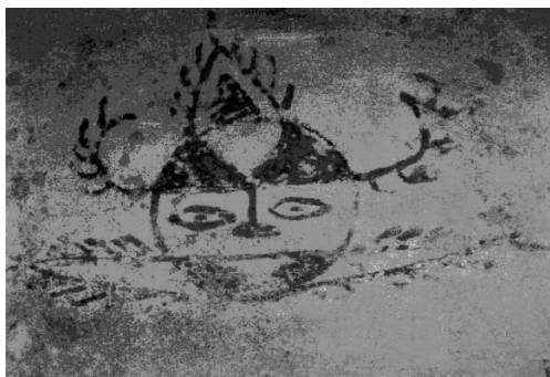
◎ 仰韶文化人面鱼纹图案

在中国原始时代考古遗迹中,发现了不少与图腾有关的形象。西安半坡和临潼姜寨出土的彩陶盆上,绘有一种人面鱼纹。有的学者认为,这种人面鱼纹可能与仰韶文化的图腾信仰有关。