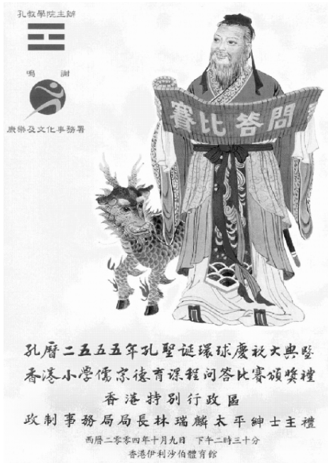
◎ 孔教学院祭礼大典节目单

就在孔圣人被批判的同时,也并存着尊孔思潮。1912年,康有为支持陈焕章在上海成立孔教会,并创办了《孔教会杂志》,提倡尊孔读经,祭孔配天。1913年8月,孔教会上书国会,要求定孔教为国教。袁世凯任总统后,亲自到孔庙祭孔,但宣称祭孔不是宗教。随着袁世凯政府的垮台以及宣统皇帝复辟的失败,孔教会失去了与