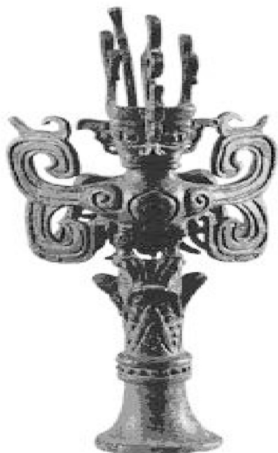
◎ 三星堆人首鸟身铜器

在四川广汉三星堆文化中,可能也存在着太阳神崇拜。在考古发掘中,出土了一件太阳形铜器。有学者认为,这种近似车轮的青铜器是古代蜀地的人们崇拜太阳神的象征物。该器在圆凸中心