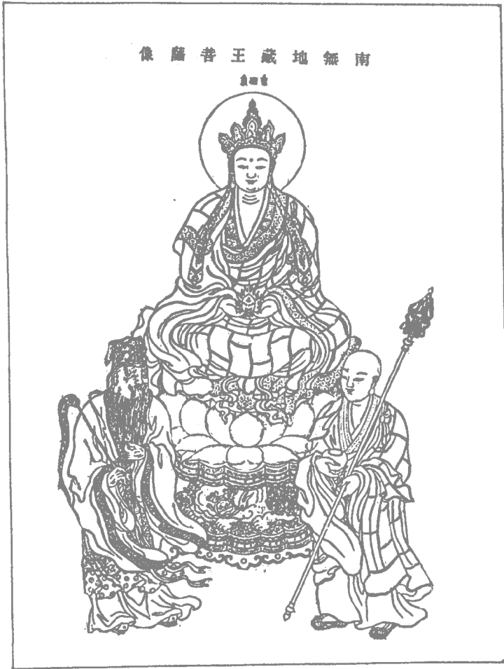
地藏 道明 闵公