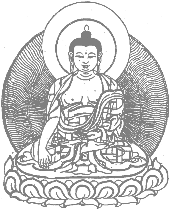
释 迦 像

同时，我们应看到，世界上无论任何人，对于万事万物，各行各业，能够取得伟大成就、立言、立功、立德、立业没有不由最初一念发广大心、立坚固愿而努力争取，达到圆满的目的。佛法世法，在这个问题上，事虽有不同，理并无二致。