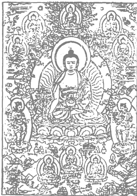
药 师 佛

最有趣的是，十二神将的形象与我国民间流传的十二生肖有关。宫毗罗头戴鼠冠，伐折罗头戴牛冠，迷企罗头戴虎冠，直到最后的毗羯罗头戴猪冠，其次序与十二生肖完全吻合，毫厘不爽。想来，它大概是印度佛教与中国文化两者相结合的产物罢。