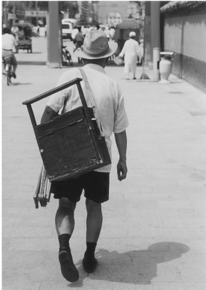
“面人汤”老人拎着小马扎背着箱子行走在沈阳街头

他住的屋子的门上贴着门神，门缝处用一把斧子塞着。将斧子放到地上，说明一种希望——“斧”同“福”吧？！地上还有一个伴随他走街串巷多年的小马扎。那是可以折叠的凳子，凳面是草绿色绑带，软的，一条条均匀地固定着，折叠起来时，绷紧的绑带便松弛下来。正是这个