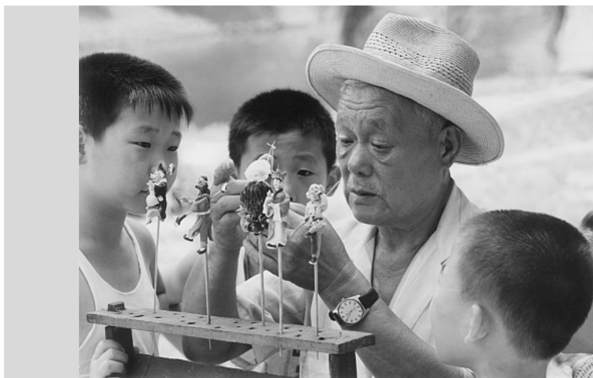
“面人汤”捏的面人，总是招来一双双好奇的孩子的眼睛