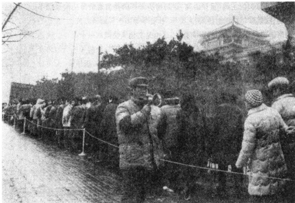
1989年1月 观众在寒冬排队参观 “油画人体艺术大展” [图 43]

在中国美术馆举办,这是我国有史以来的第一次,裸体艺术在中国又向前迈了一步。展览开幕,文化部副部长英若诚剪彩,各界嘉宾云集,中外记者如潮。展览期间,购票观众冒着凛冽的寒风排起长龙,总数达20余万人次,再次震动京城[图 43]。展览中写实性风格备受青睐,除了老一辈画家外,青年画家杨飞云的作品尤为引人注目。展览的意义是多方面的,其中一点是又给中国百姓做了一次艺术普及——能吸引几十万人去看画展,这本身就是奇迹。如果说观看裸体形象还可能居于某种欲念的话,那随着人流的蠕动认真阅读展屏上的《世界裸体艺术发展简史》,就不得不正视此中的文化意义了。