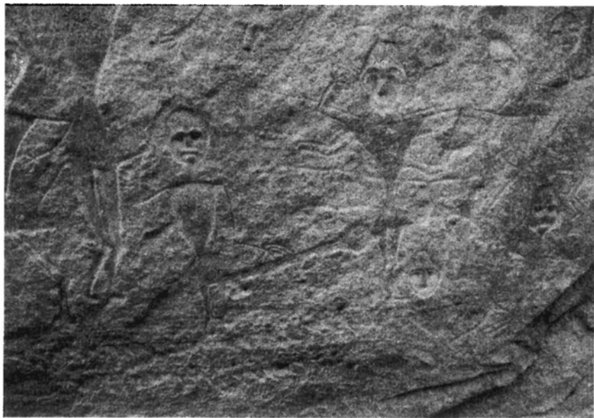
原始岩雕刻画 康家石门子 [图 3]

当然，社会因素是更根本的。性使人认识自身，并将人类由野蛮带进文明。但它们又是最异己的，图腾时代首先就是对母子乱伦的禁忌；文明的结果则是首先对性的限制，这是明显的二律背反。本来从进化的需要赋予了男性的多结合、多育的天性，透过文化而变成了自私和放荡。限制与反限制的结果，到底还是形成了依旧不平等的性道德和性分工；多妻的社