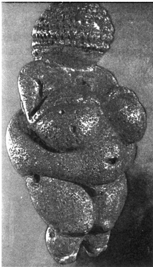
原始雕刻 维伦堡的维纳斯 [图 1]

人类最早再现自身的艺术就是裸体艺术,当然,这是广义的界定。距今约三万年的奥地利《维伦堡的维纳斯》[图 1]等原始雕刻就是例证。这些作品也许与初民的巫术、宗教活动有关,寄寓了对“两种生产”的祈求。然而,在这功利的后面却凝结了对性快乐的满足与依恋。中国长期被怀疑为例外,但 1983 年辽宁喀左县红山文化的《牛河梁女神》[图 2] 否定了这一猜想;1988 年初公布的新疆呼图壁县的巨型原始岩雕刻画[图 3]又进一步提供了例证,那里刻有大量表现生殖活动的裸体男女人物形象。人,在对自身的审美意识的产生过程中,一开始就打上了性的烙印。而文明时代的裸体艺术,也即狭义创作的裸体艺术,则是原始图腾时代就存在的潜意识欲望升华的产物。