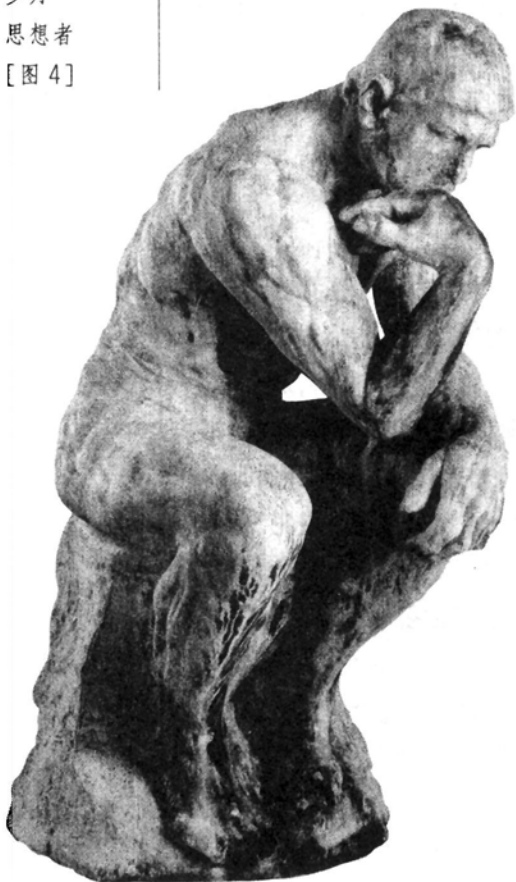
罗丹 思想者 [图4]