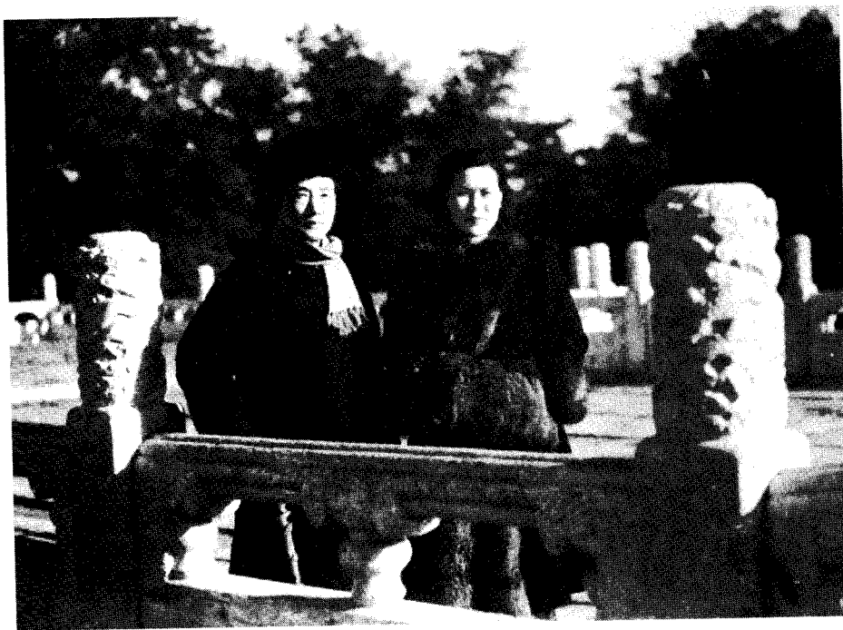
1950年，徐悲鸿和廖静文在北京