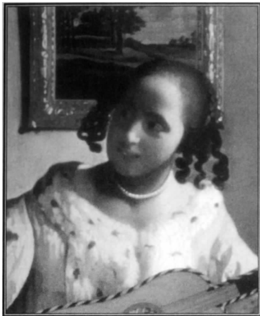
图 10 约翰内斯·佛梅尔（ 角社角社角社 ，1632—1691）：《弹吉他的女人》，创作于 1670 年，布面油画，尺寸 11 英寸。伦敦，肯伍德博物馆（ 角社角社角社 ）。

此外，一些艺术家和传统习俗比其他人更加青睐微笑。比如 17 世纪和 18 世纪的荷兰风俗画，代表人物是扬·斯泰恩（ 角社角社 ）。即使是以冷静和内省著称的约翰内斯·佛梅尔（ 角社角社角社 ），也画了大量带着笑容的人物（图 10）。比较起来，在非洲和前哥伦