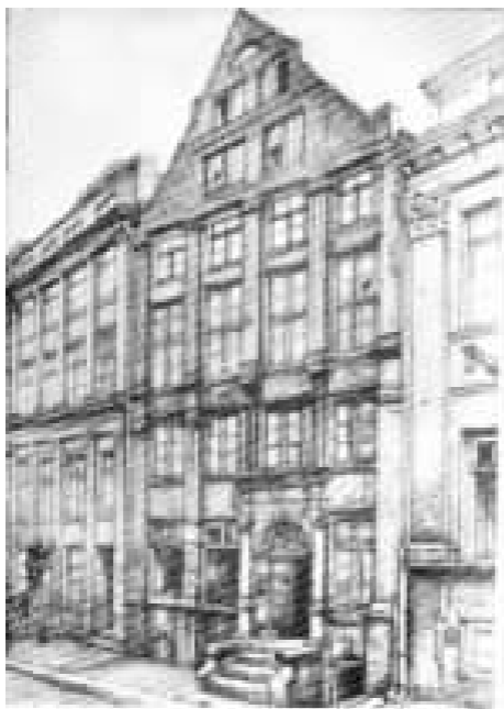
叔本华家在汉堡的住宅，新万特拉姆街 92 号

里西亚和普鲁士的旅行时，叔本华这样说：“很清楚，这次旅行花费了我两年的青春时光，两年的时间可以用来学习古典学科和语言，从这个角度来说，时间是白白浪费了。可是尽管如此，我仍认为，旅行的收获难道不是对我更有利，从而弥