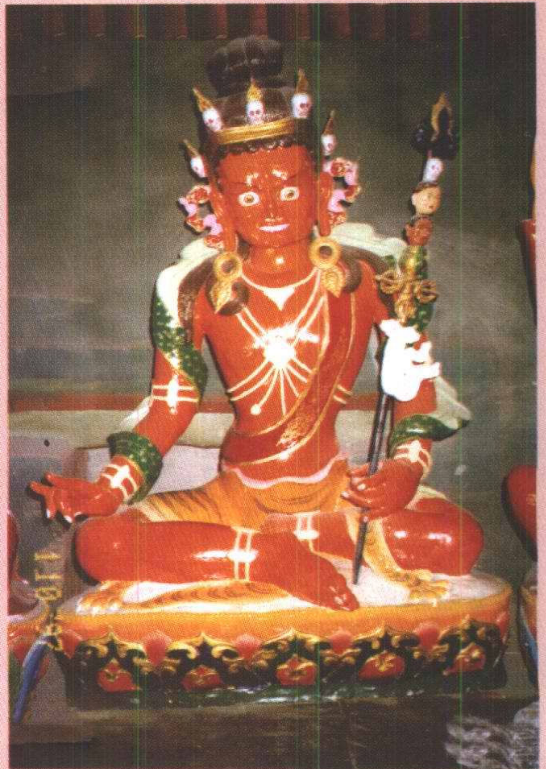
日光上师 ལུ་སུ་ཉི་མ་འོད་ཟེང་།