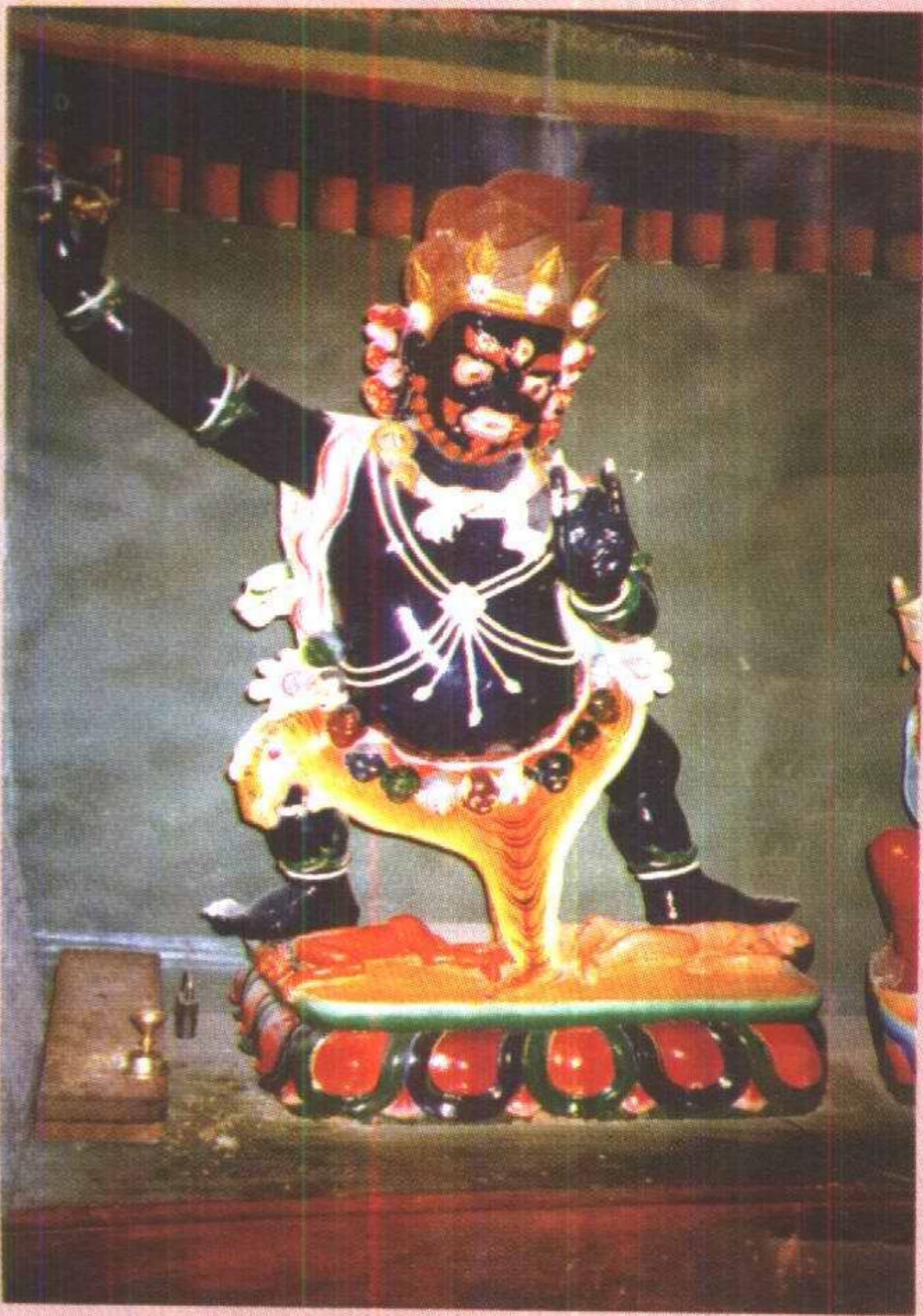
狮子吼上师 ལུ་ཅན་ལོ་ལྷོ་གྲེད།