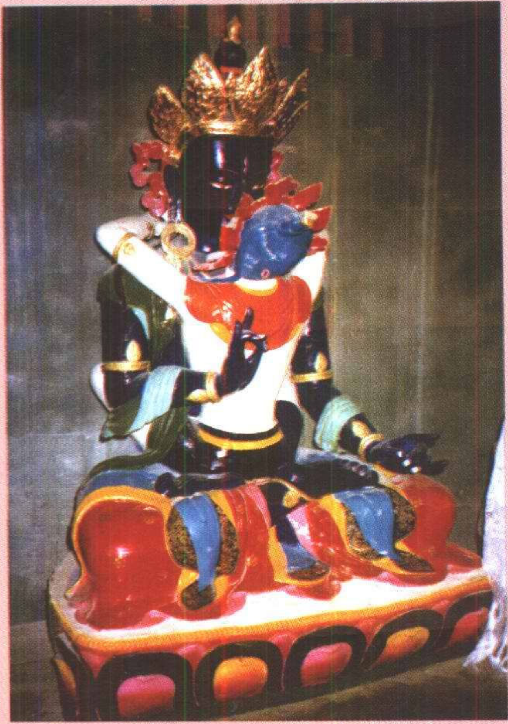
持金刚上师 ལུ་སུ་ཨོ་ཀུན་དོ་ཇེ་འཆང་།