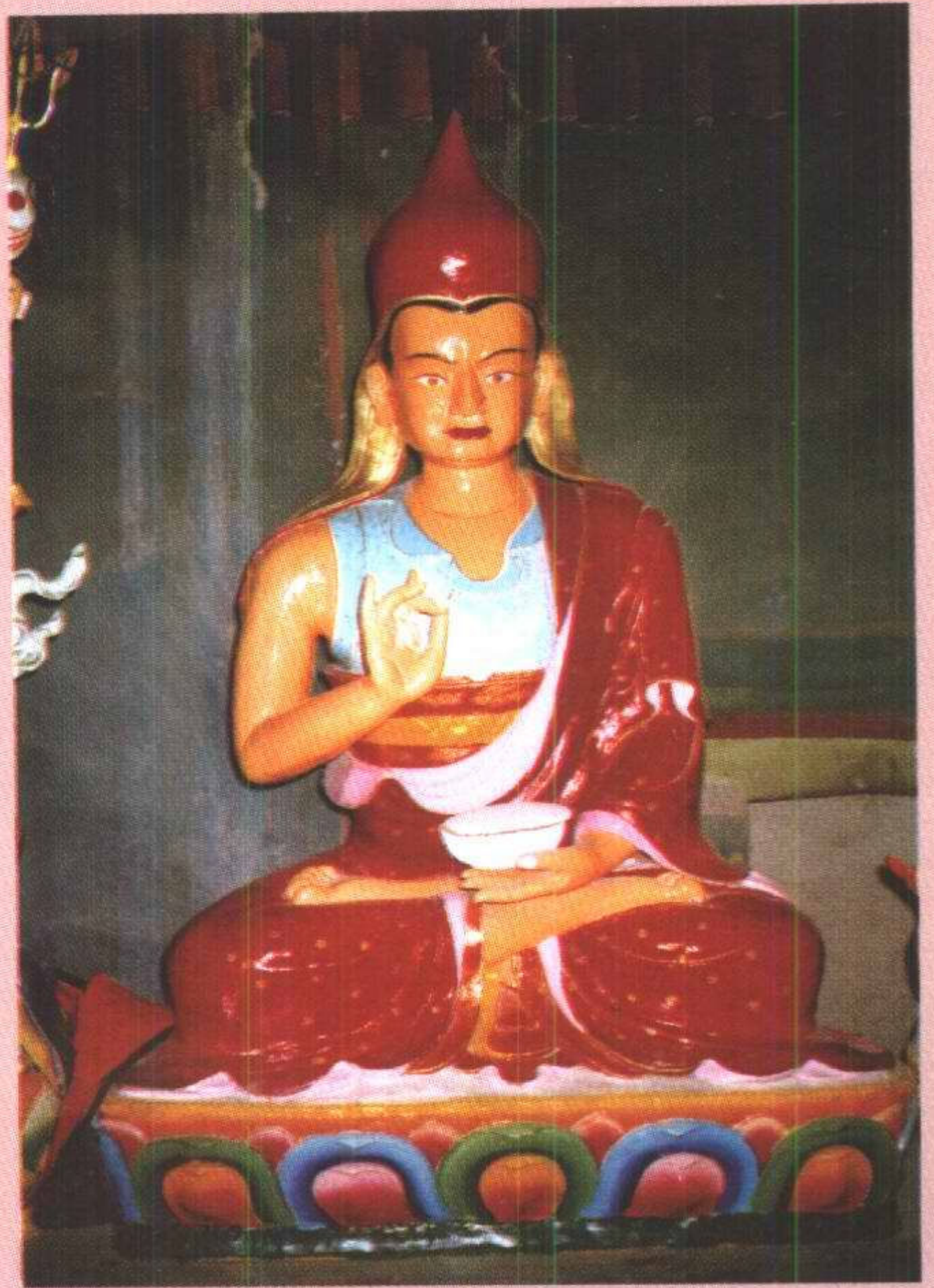
莲花萨巴瓦上师 ལུ་སུ་བུ་ལྷ་མོ་བ།