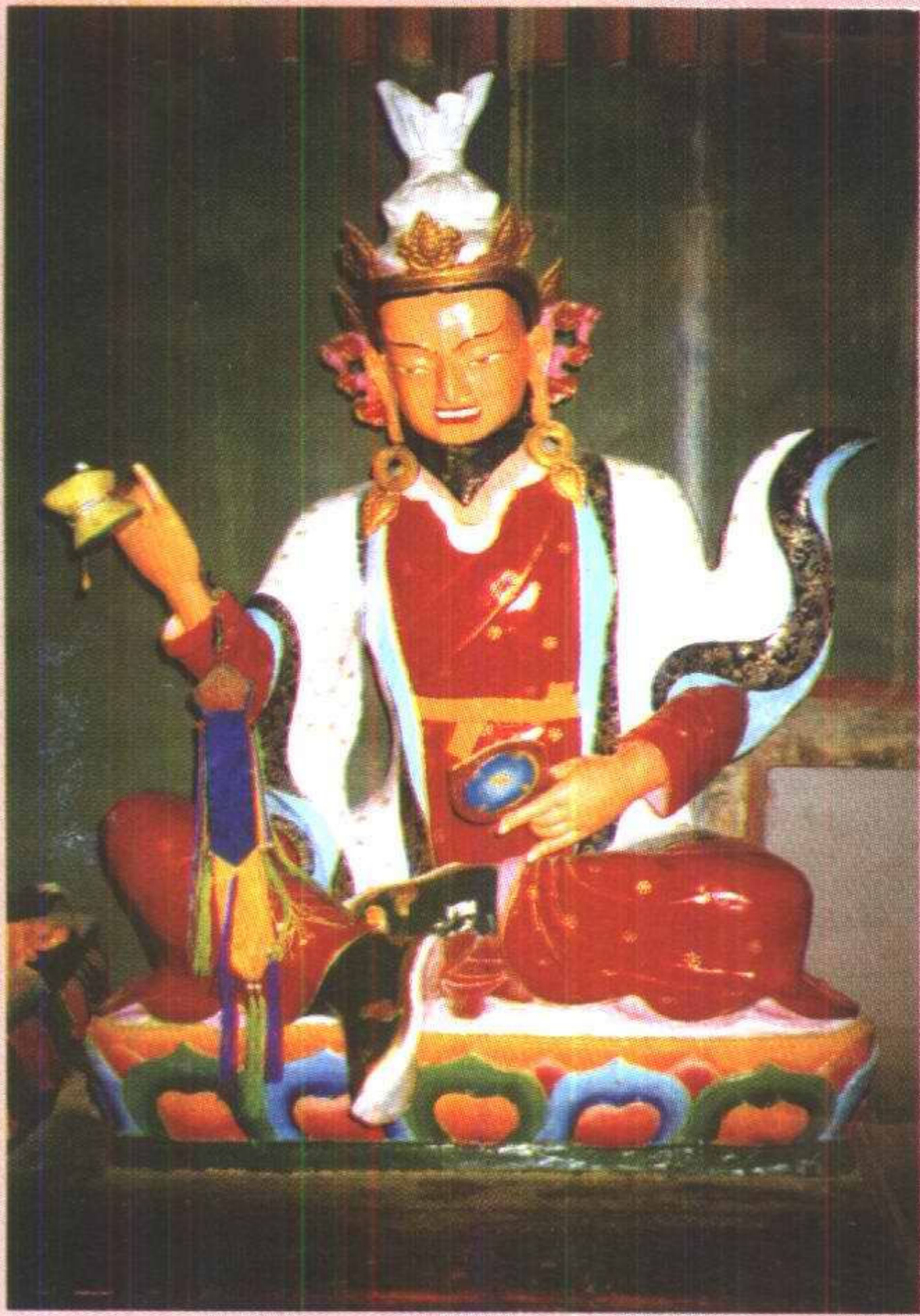
莲花王上师 ལུ་ཅན་པདྨ་ཀྲུ་ཡ་པོ།