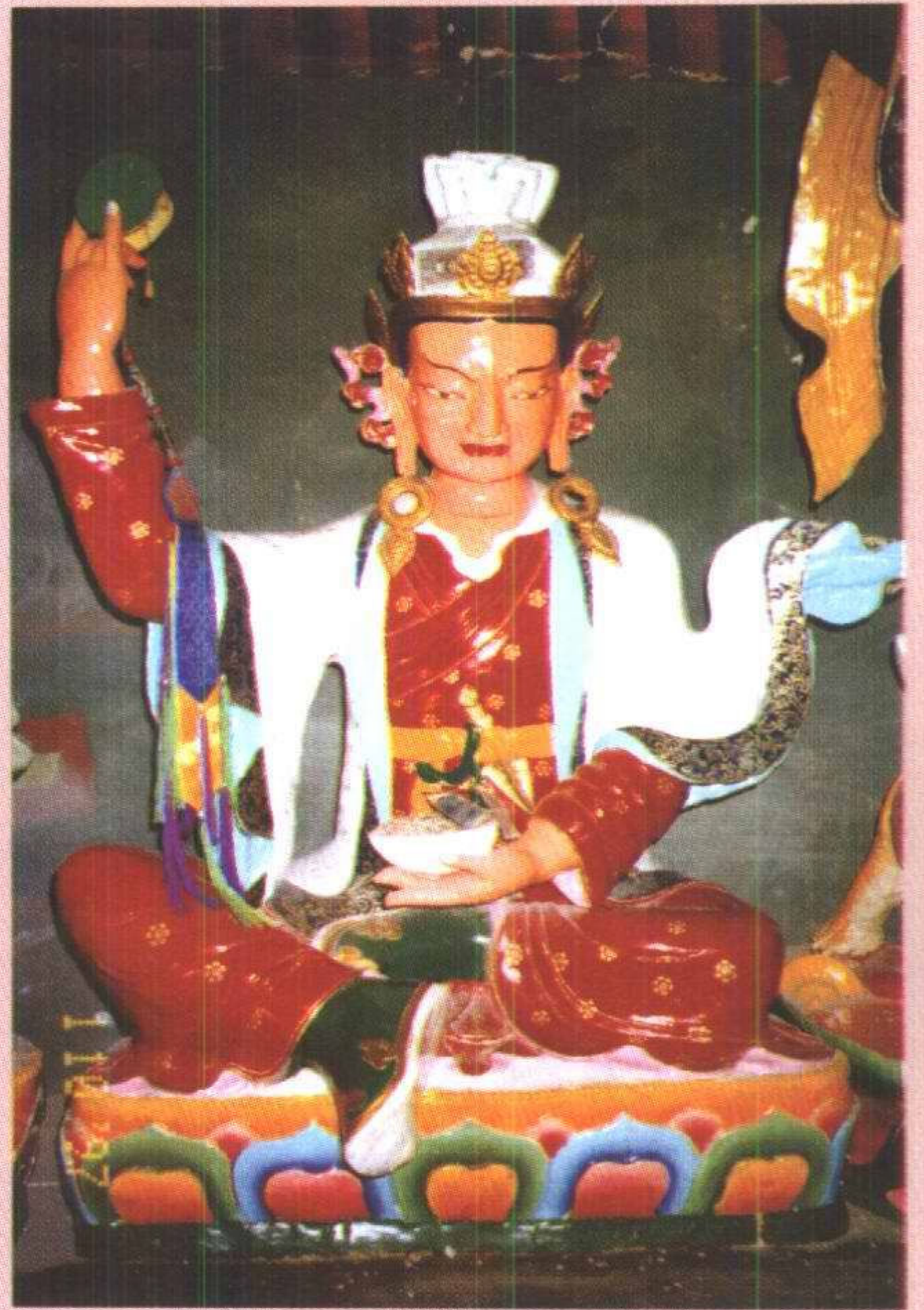
爱慧上师 ལུ་ཅན་སློ་ལྡན་མཚོག་གྲེད།