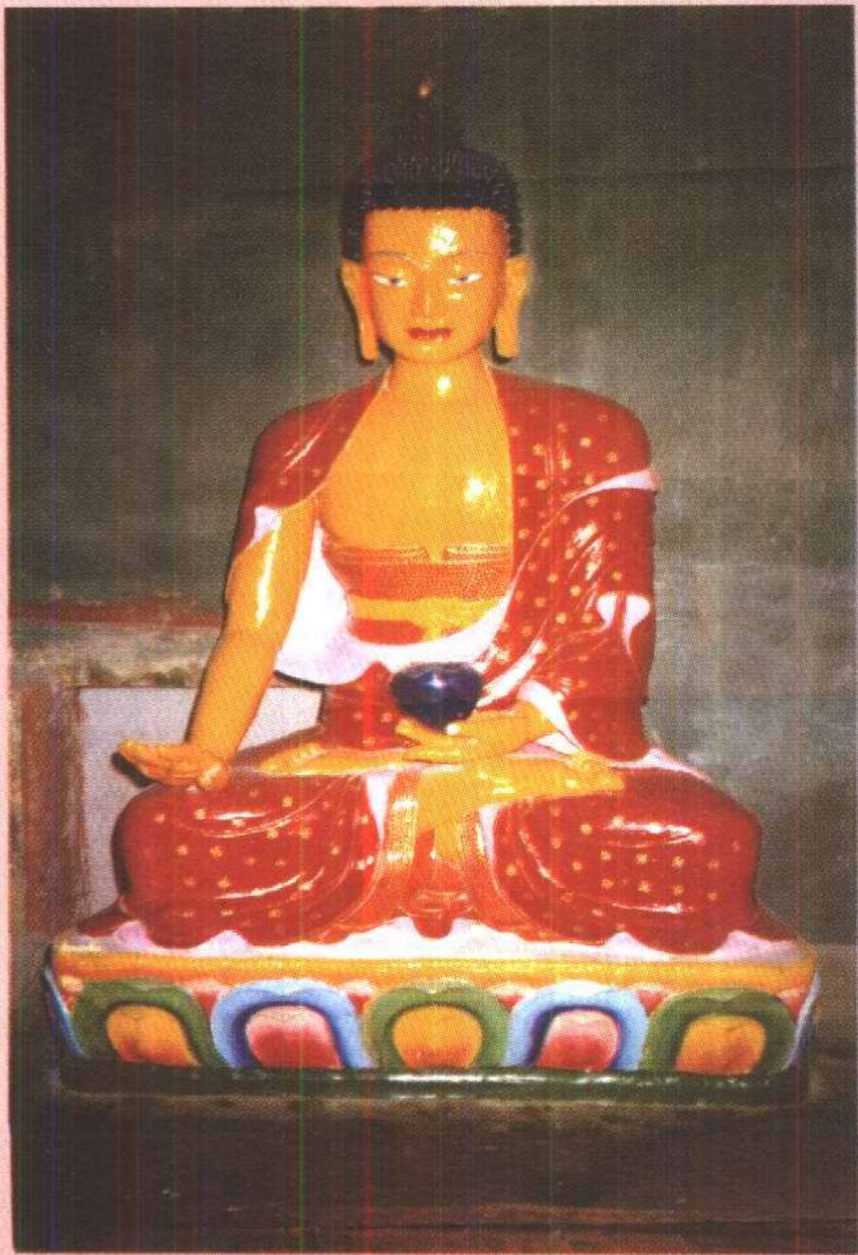
释迦狮子上师 ལུ་སུ་ལྷ་མོ་མེད།