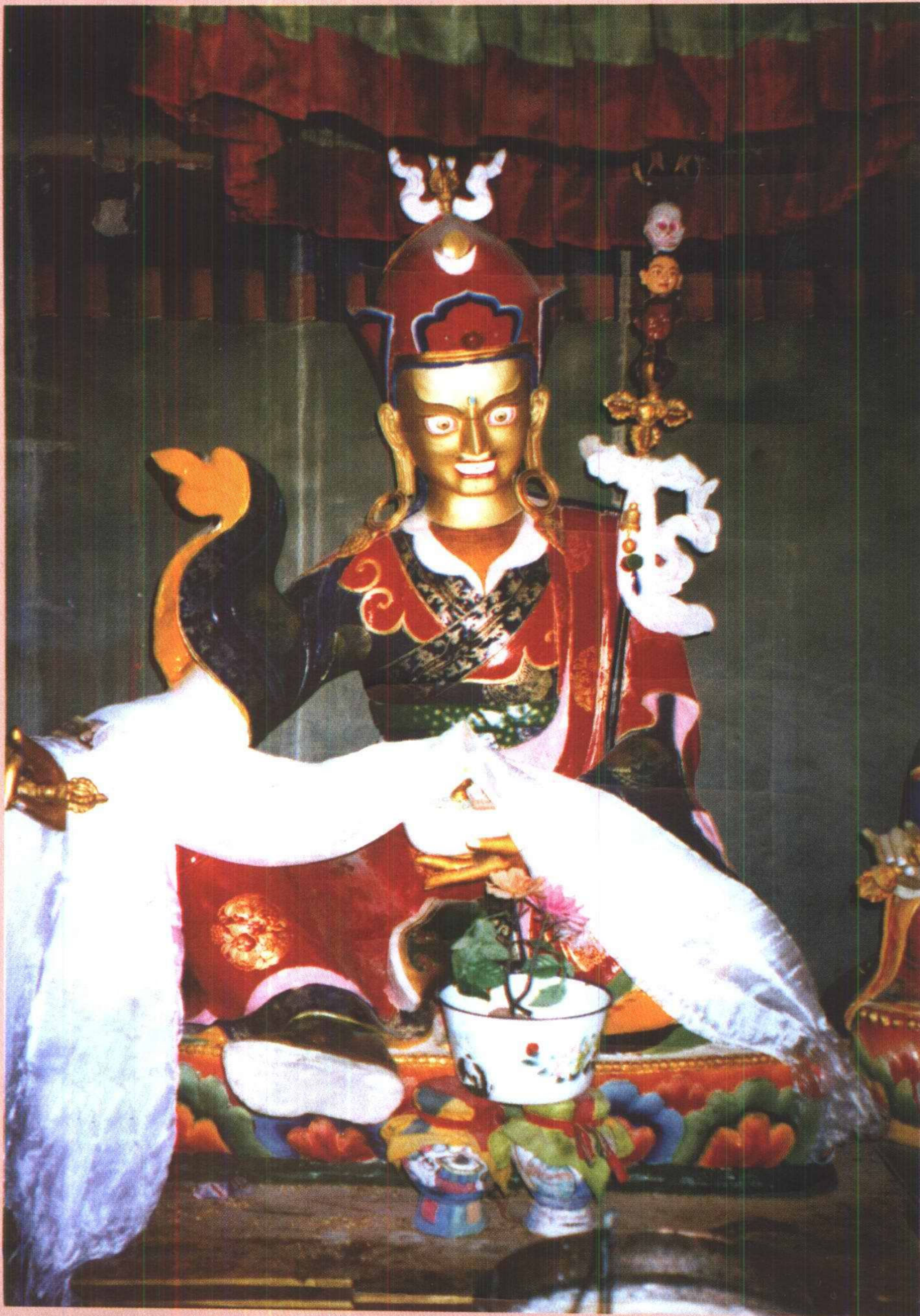
蓮花生大師 ལུ་ཅན་པོ་ལྷན་པ་གནས།