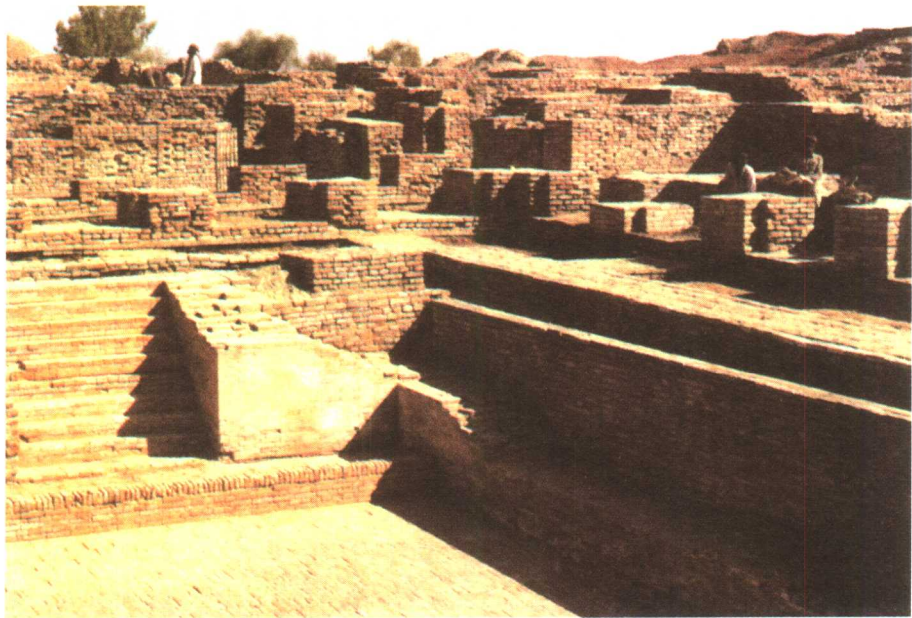
| 摩亨佐·达罗城里的浴池

有“伽蓝十所，天祠数百”。在旁遮普这个地方，有五条河汇合，所以此地也被称为“五河之地”。“班贾布”是旁遮普印地语的原始叫法，这个词分开来就是“五”和“河流”两字，这里是印度河流域土质最肥沃、物产最丰富的地方，曾产生过辉煌灿烂的文明。