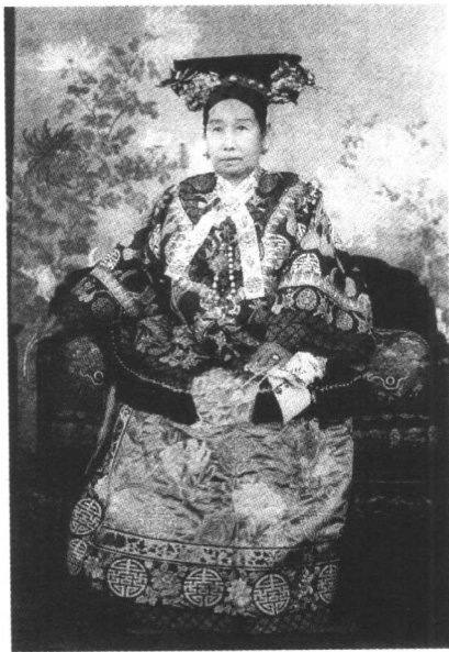
号称“圣母皇太后”的慈禧(1834—1908)。

恭亲王奕訢 ① ，在咸丰朝本来不是个得意的人物。咸丰把奕訢丢在北京去办议和，这件苦差事却给奕訢造成了机运，奕訢代表清廷和英法联军办了和议，接受了空前丧权辱国的《北京条约》，颇受到洋人的赏识。这位得到洋人支持的“皇叔”，自然不甘居于肃顺这班人之下，再加上素来嫉恨肃顺的王公大臣的怂恿，恭亲王于是跃跃欲试了。正在这时，忽然有人秘密地从热河“离宫”带来了两位太后的懿旨。