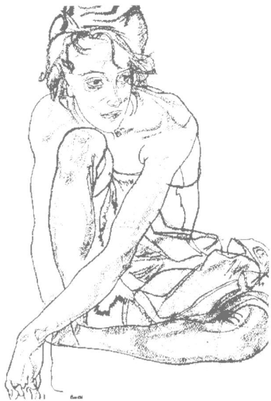
图例 2-6 坐着的女人 席勒[奥]

的夸张运用,展现在人们面前的是一个全新的图象。这种速写暂不适用于初学者。(图例 2-5、图例 2-6、图例 2-7)