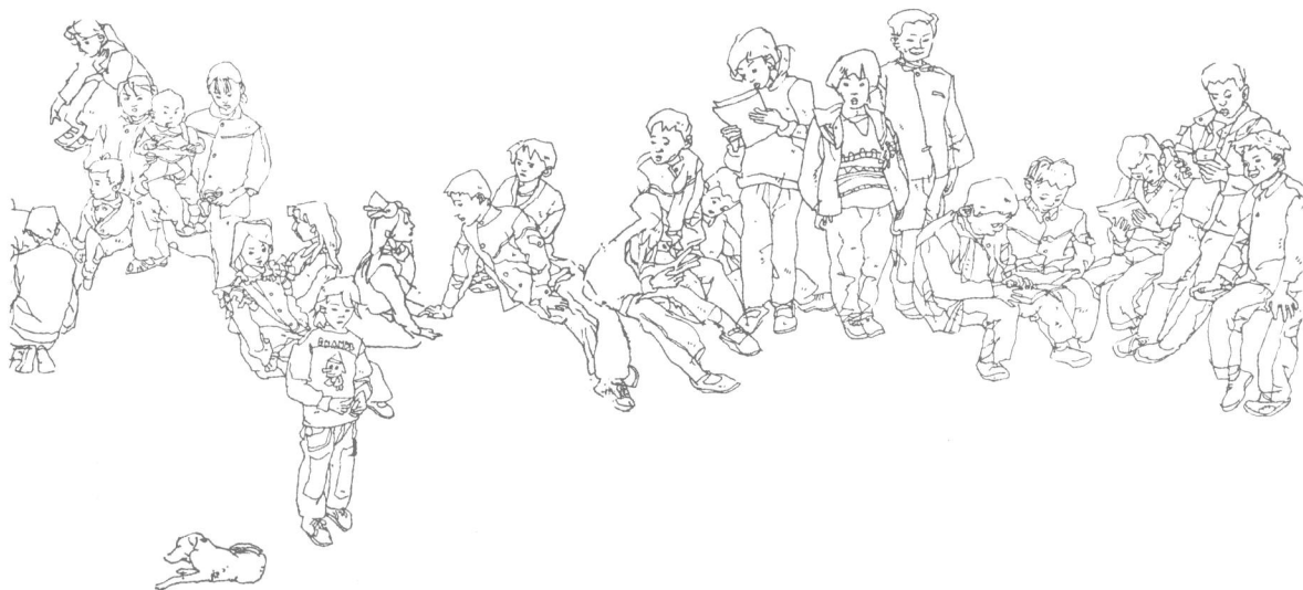
图例 2-8 村里的孩子

多的事物是有生命的、活动的,往往画了一半或刚下笔,对象已经变了,因此,应该学会凭借记忆、想像来完成这些未完成的速写。其实在任何形式的速写中,记忆和想象总是艺术家的双翼,缺一不可。