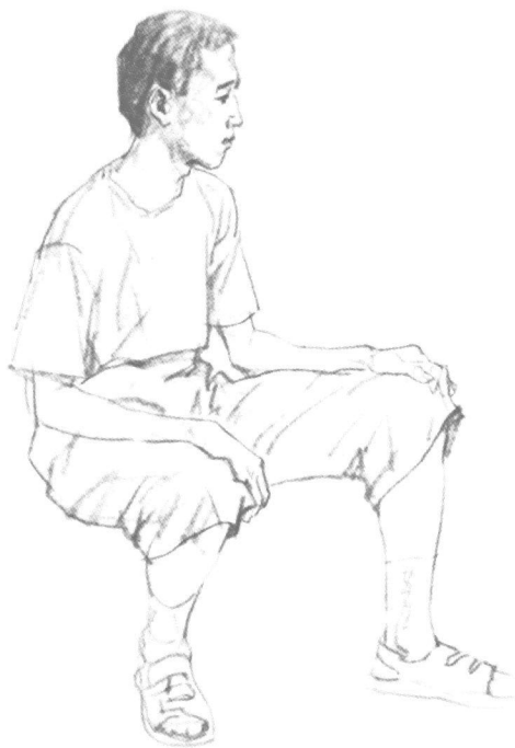
图例 2-1 写实性速写 孔凡瑞

我们通常所画的速写一般为写实性速写。其目的是在短时间内用线条或明暗等手段把所观察到的物象的结果表现出来,对物象的比例、结构、动态、神韵以及造型特点、空间透视等关系力求表现得准确而生动,这在基本功训练当中尤为重要。