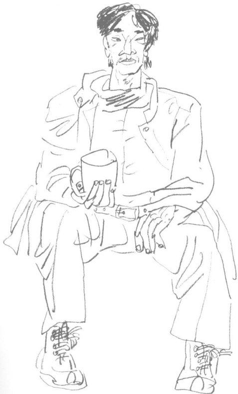
图例 2-5 拿杯子的青年 马忠贤

表现性速写与写实性速写的最大区别在于它不是简单如实地表现物象的外部特征,而是在此基础上更多地融入了画家的主观意识,是借助于物象的基本因素加以不同程度的夸张甚至变形。这种速写更多地体现出画家的感情色彩。此时客观物象已显得不是那么重要,重要的是画家激情的宣泄和独特的理解方式。这与画家的生活阅历和审美素质有着密切的关系。因此,可以说表现性速写不完全是对象写生的。当然,它也不是以客观真实地表现对象为目的的。我们可以从席勒等画家的作品中感受到这种情绪。