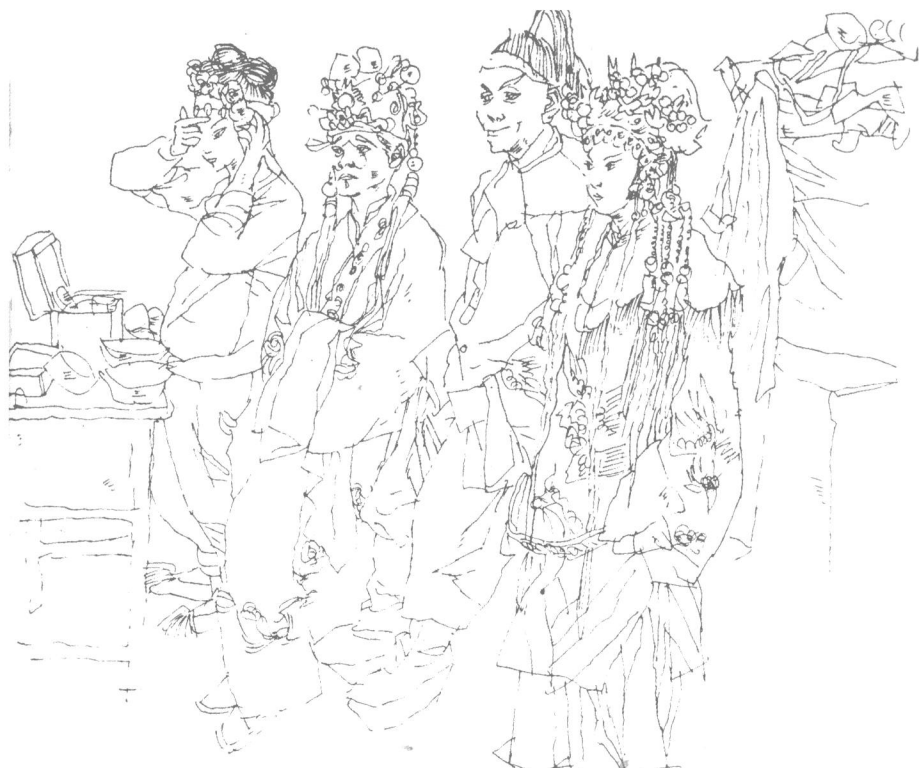
图例 2-9 幕后

这是传统戏剧演出前演员们在后台化妆时的情景。画家通过目识心记,将写生和默写相结合,把这样一个典型的生活场景表现得亲切、自然。足见画家对生活的敏锐感受。