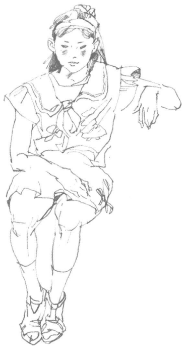
图例 2-2 婷婷 金纬

用较长的概括性的线条确定了人物的姿态,较严谨地把握了人物身体各部分的结构、比例关系,注意整体性,对人物的脸部和手部也有着重的刻画。