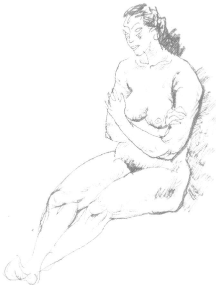
图例 2-7 女人体 金纬

流动舒暢的线条表现略带夸张的造型并强化了人体的韵律、结构,少许轻松的色调表现出皮肤和布褶、衣纹的质感,整幅画面有较强的表现力。