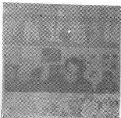
市委副书记、市长、市志编纂委员会主任凌浩在大会上讲话