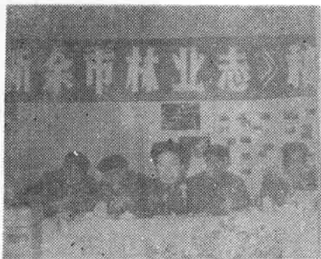
副市长李炯辉在大会上作总结