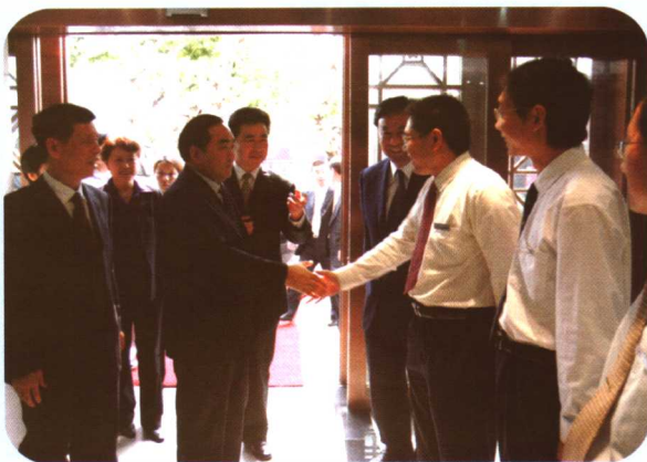
工商银行浙江省分行党委书记、行长徐新桥陪同工商银行行长杨凯生(左二)考察基层营业网点。

中国工商银行浙江省分行将以股份制改造为契机，以国际一流的商业银行为目标，认真落实科学的发展观，加快推进经营战略转型，努力打造核心竞争力，竭诚为广大客户和社会各界奉献一流的服务，在现代金融企业建设道路上迈出新的步伐！