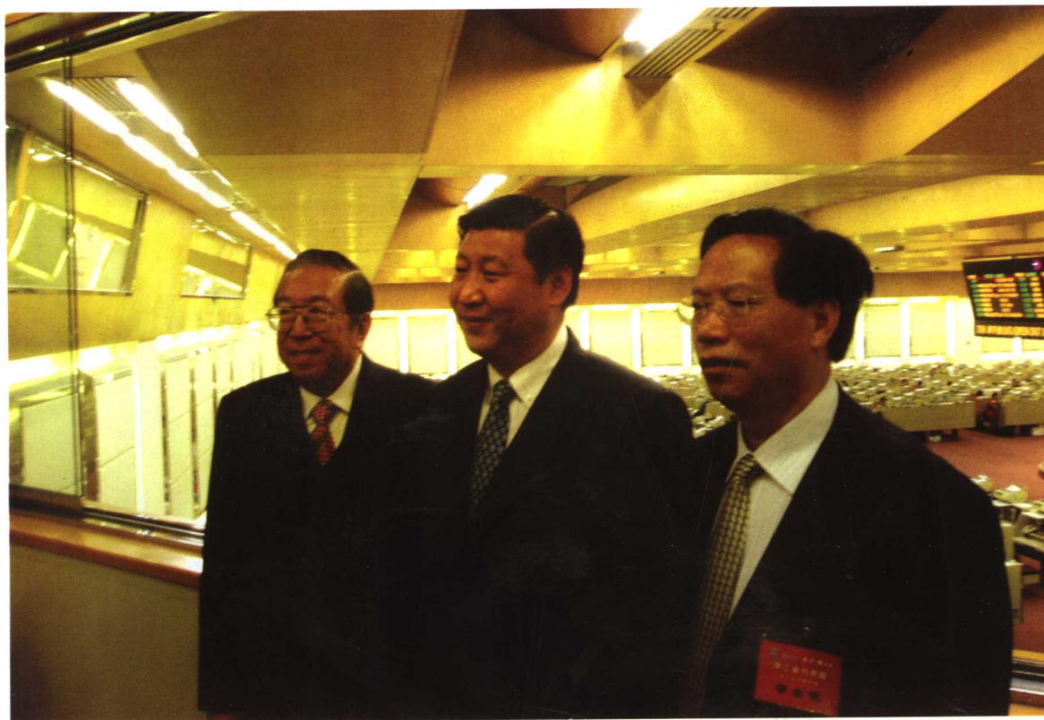
▲中共浙江省委书记、省人大常委会主任习近平（中），省政协主席李金明（右）在香港交易所主席李业广（左）的陪同下考察交易所