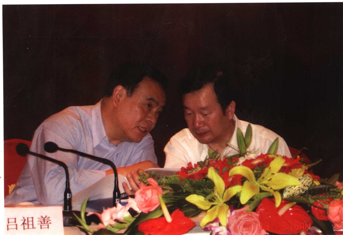
▲浙江省省长吕祖善（左）、常务副省长章猛进（右）在2005年全省金融工作会议上