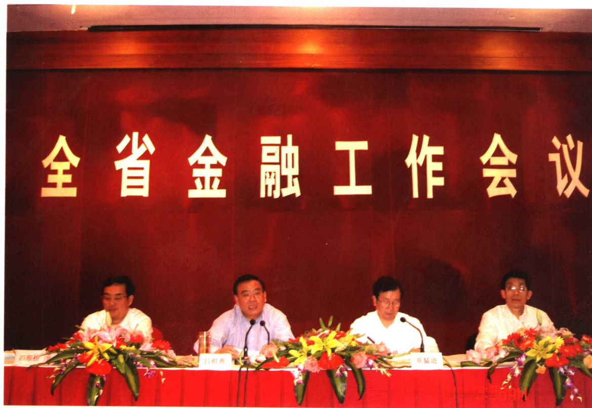
▲浙江省省长吕祖善（左二）、常务副省长章猛进（右二），省政府秘书长冯顺桥（左一）、副秘书长陈国平（右一）在2005年全省金融工作会议上