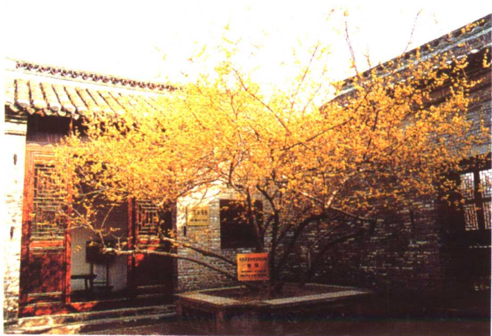
● 周恩来童年浇灌过的腊梅