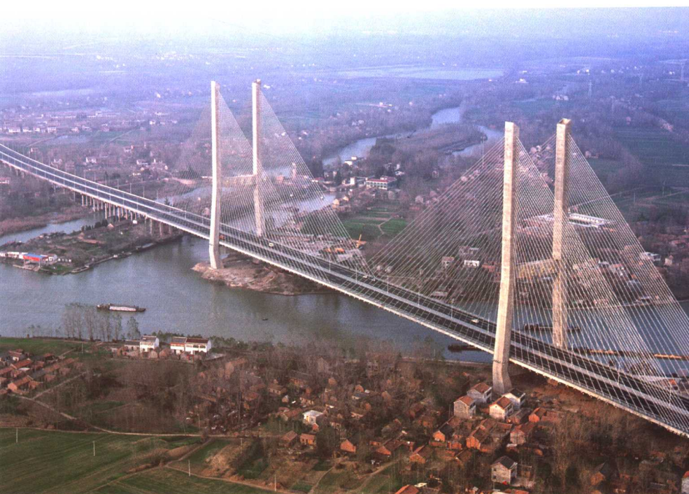
● 跨越运河的淮安大桥