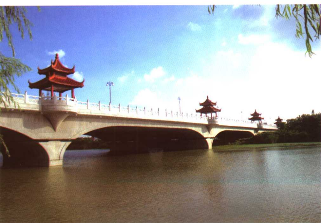
● 里运河上的八亭桥