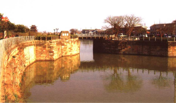
● 明代建筑的清江大闸