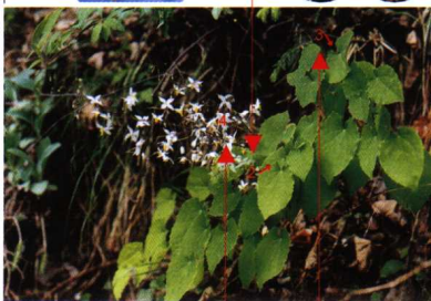
▲ 原植物 心叶淫羊藿