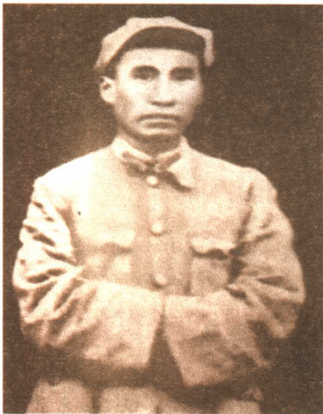
爷爷在红军时的照片

1931 年 3 月，敌人又调集 20 万大军对中央苏区发动了第二次“围剿”；5 月间，中央红军在 15 天内由西向东横扫 700 里，五战五胜，歼敌 3 万余人，取得了第二次反“围剿”的胜利。