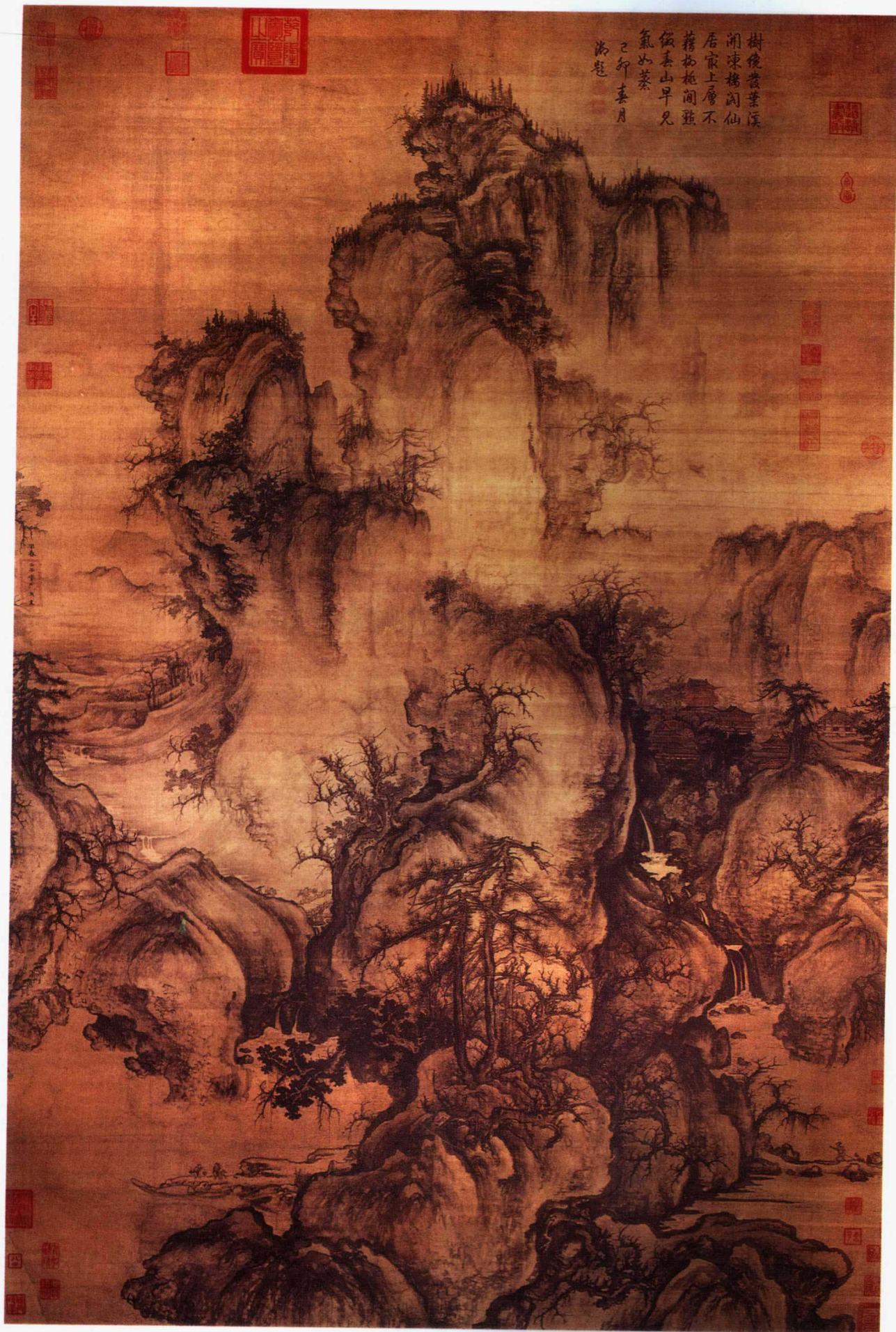
早春图 郭熙 绢本 (108.1×158.3cm)