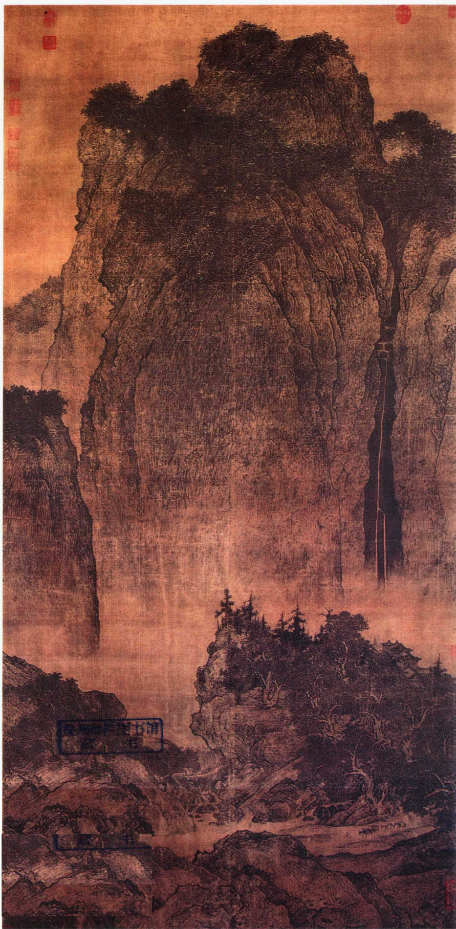
溪山行旅图 范宽 绢本 (103.3×206.3cm)