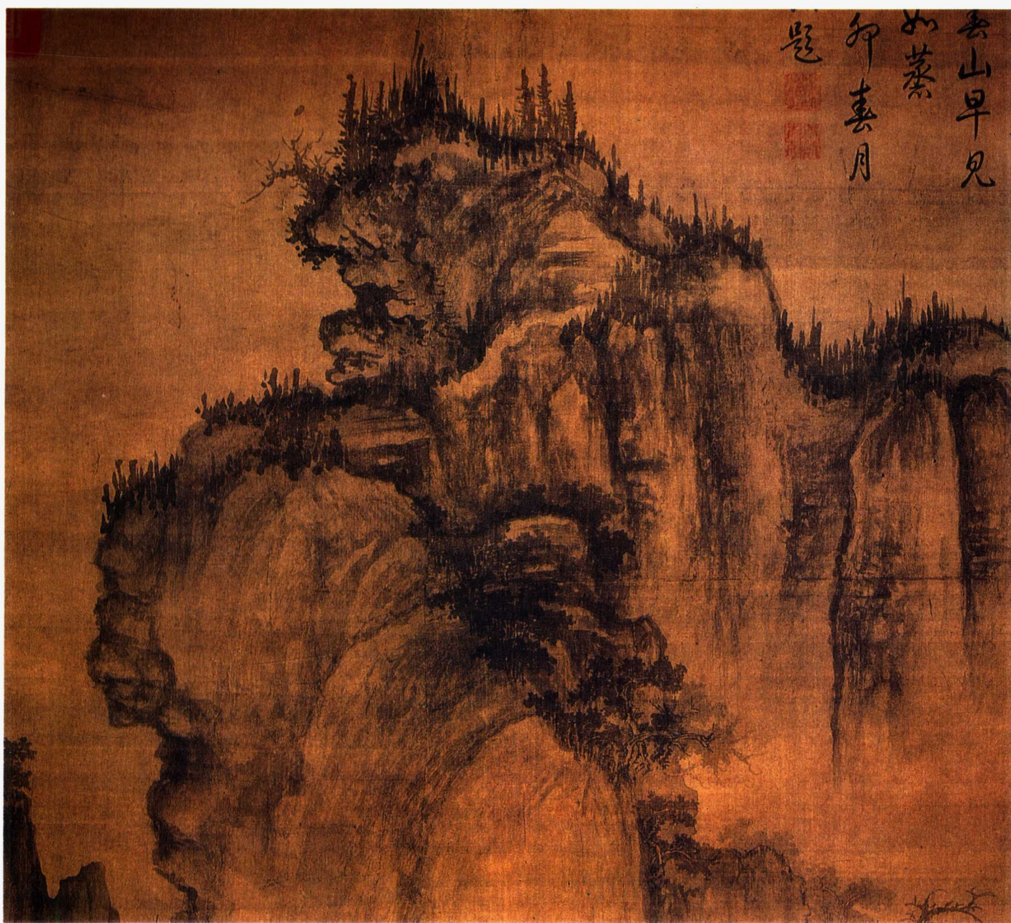
早春图 郭熙 (局部)

主 编 邓嘉德 责任编辑 张大川 谢建国 装帧设计 邓嘉德 张大川 谢建国 画册撰文 邓嘉德 谢建国 张大川 画册终校 杜娟