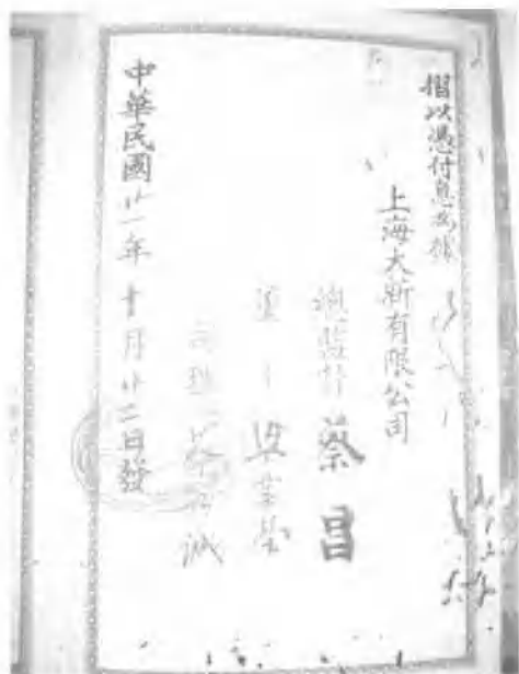
◀ 上海大新公司取貨摺