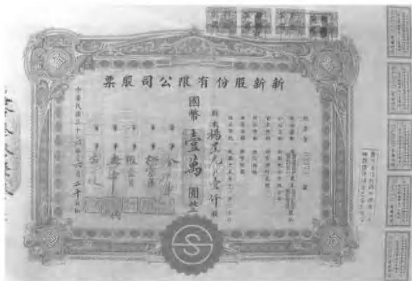
▲ 上海新新公司股票