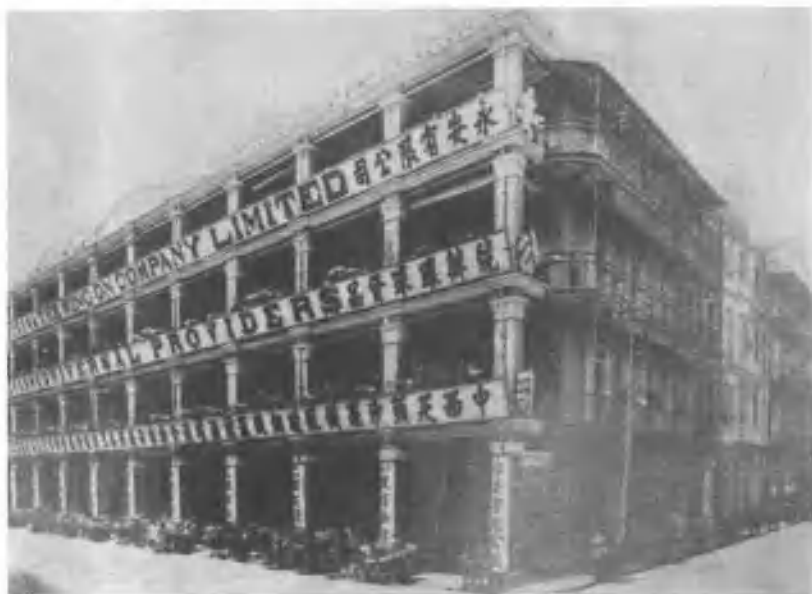
▲ 早期的香港永安公司