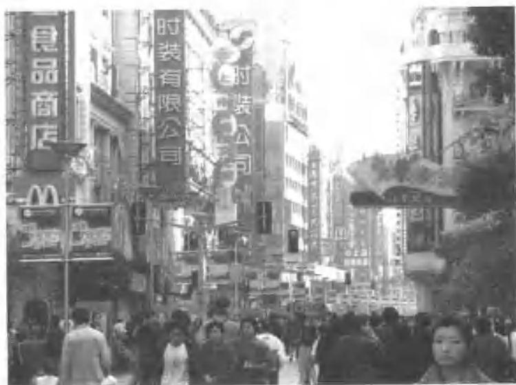
▲上海南京路步行街