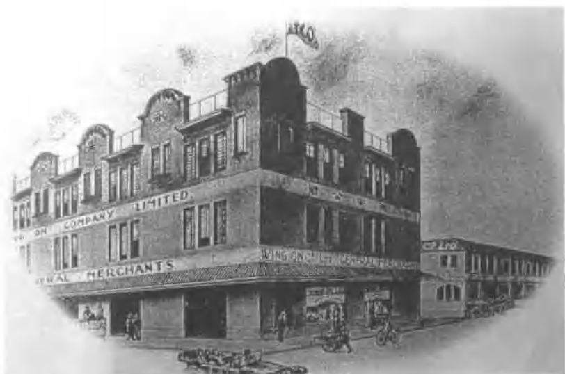
▲ 澳洲雪梨永安公司