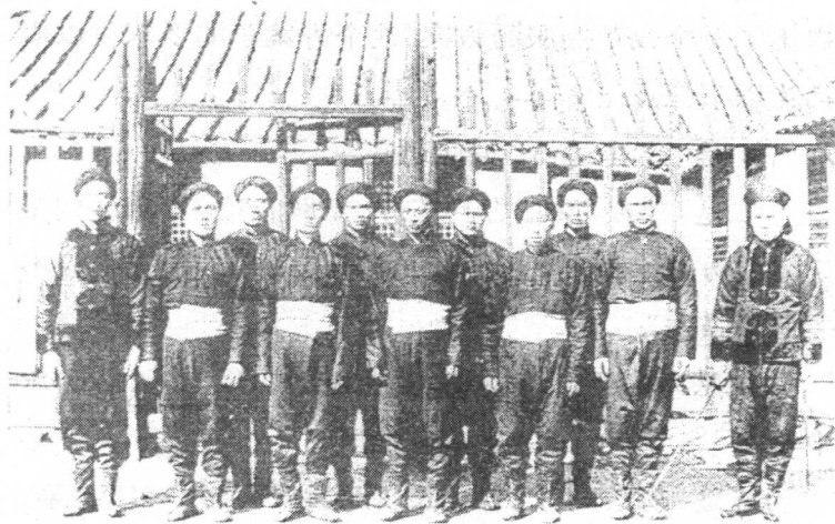
清朝北洋舰队水兵服

随着制式教练的推行，部队“操法起伏，分、合、退、旋转，均贵迅捷”，要求军服必须“改用短服，一洗旧观”。另外，随着兵种的增多，为便于战时指挥和平时管理、训练，官兵军服上需要标明军兵种和勤务专业。而清军那时的服装却是“糅杂参差，习为宽博之容，颇乏严整之象”，那种长袍马褂式军服，既不庄重整齐，又不适应操战，特别是军官与士兵的服装“分别太显，殊非战时所直”，官服“颜色华丽，易招敌目”。此外，随着门户开放，各国军队交往增多，要求有一套与国际上大体相近的服装。因此，军服改革迫在眉睫。怎么改呢？谋臣们