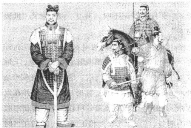
秦将军、骑士、步兵服