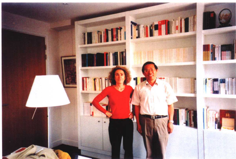
主编合影(2005年7月27日于德尔玛斯-玛尔蒂教授办公室)