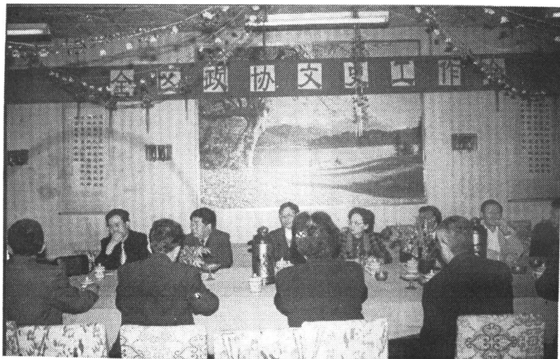
政协毕节工委文史工作会