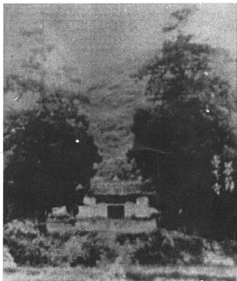
毕节南郊灵峰寺二十世纪三十年代旧貌