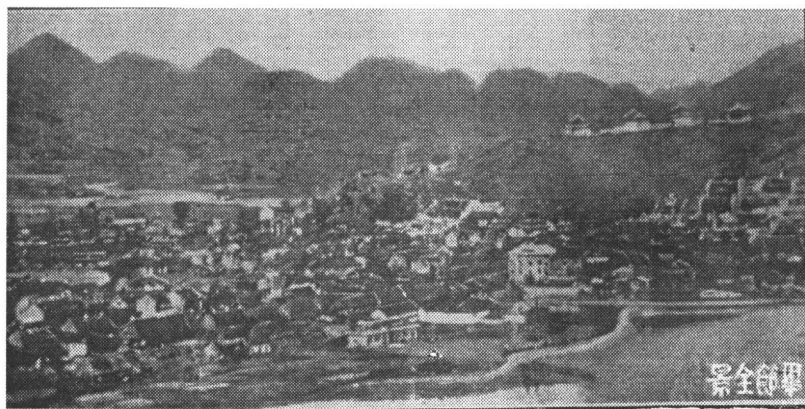
毕节城二十世纪三十年代全景旧貌全景