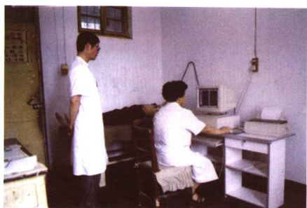
CARDIO-100A心电工作站正在为病人检查病情