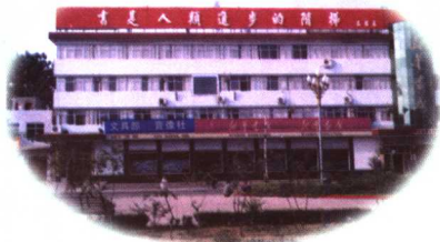
县新华书店营业办公楼