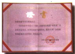
县新华书店近年来获得的国家级证书、奖牌