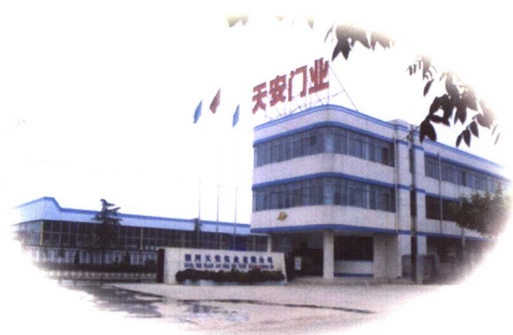
发展壮大中的天安实业有限公司