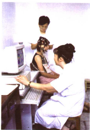
SOLAR ESA-100型 脑地形图检查仪正在为患者检查