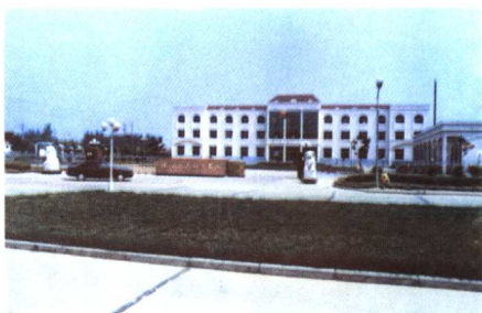
孟南工业区办公楼

几年来，孟南工业区招商引资成绩喜人，各项事业蓬勃发展，多次受到省、市、县的奖励和表彰。今年6月份，省委书记陈至元和其他领导视察孟南工业区后，对这里的招商引资工作给予了高度评价。省委副书记支树平赞叹地说：“这里是一片投资的热土，兴业的净土。”