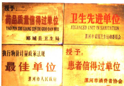
县中医院近年荣获的市、县级部分奖牌