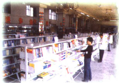
读者在东关书店选购图书