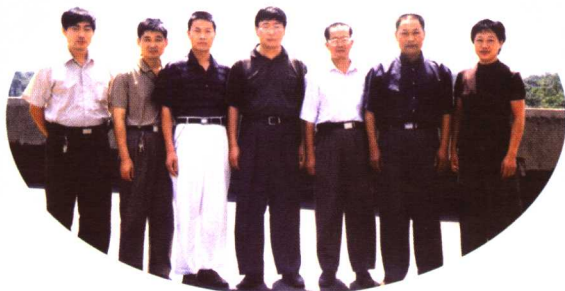
团结奋进的县中医院领导班子