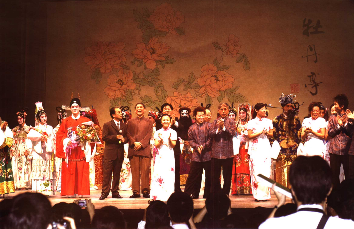
经久不息的谢幕掌声

青春版《牡丹亭》又像一个涌动无限生机和活力的张力场，势所必至的激发新的文化裂变，迸溅出前所未有的现代文化火花，增添新的文化情趣，淌出一条绿树婆娑的清澈大道，于中国新文化发展，具有里程碑意义，其奥义大矣哉。姑名之曰：“白先勇文化范式”。白氏的八个符号，支撑着这一范式的理念、实践和骄人业绩。