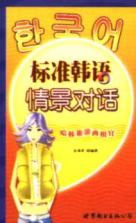
标准韩语情景对话