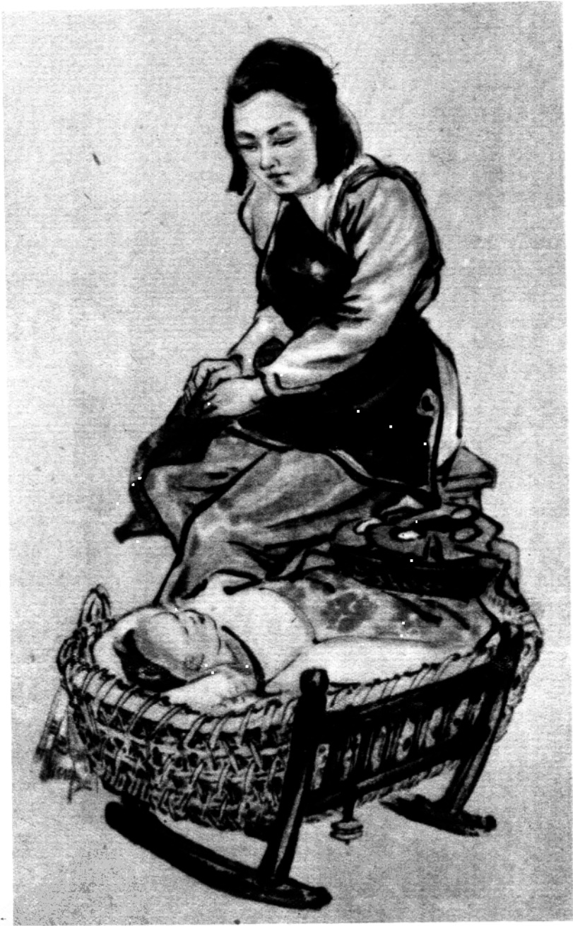
母 亲 (国画)