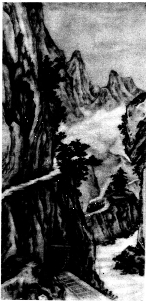
没有克服不了的困难 (国画)