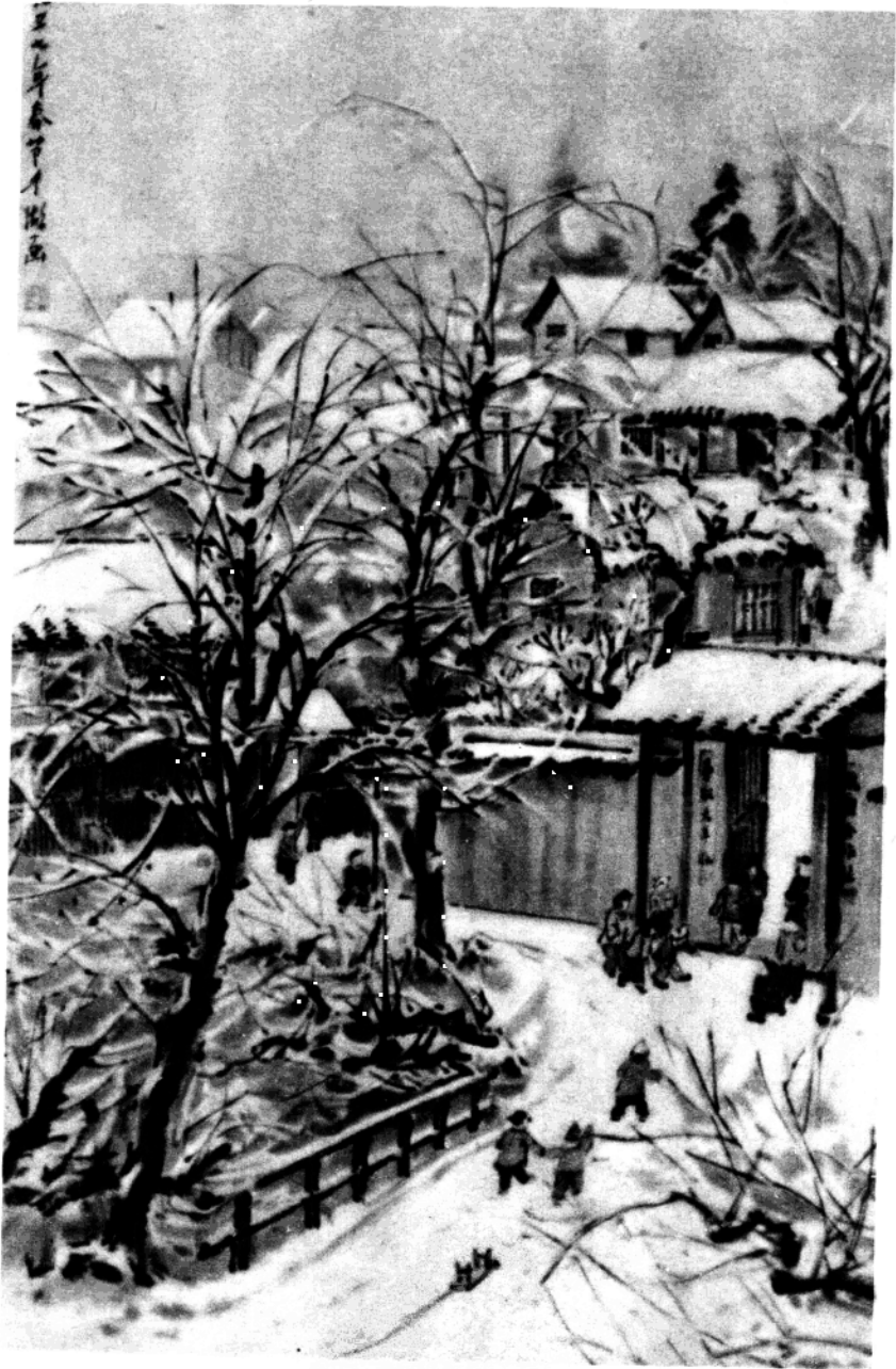
春 節 (國畫)